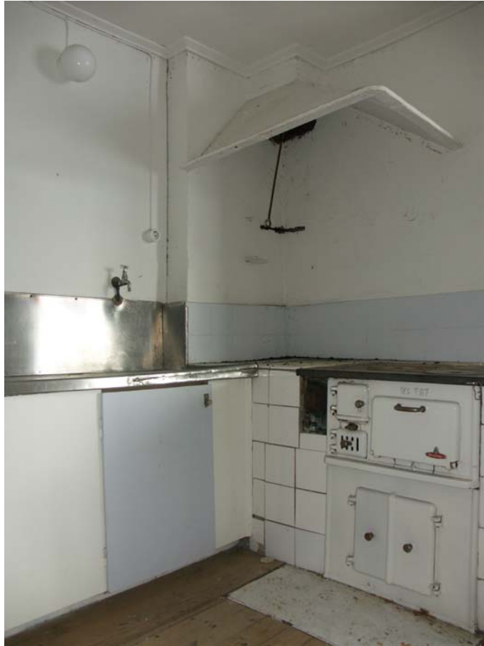
Kök med inredning från 1930-talet