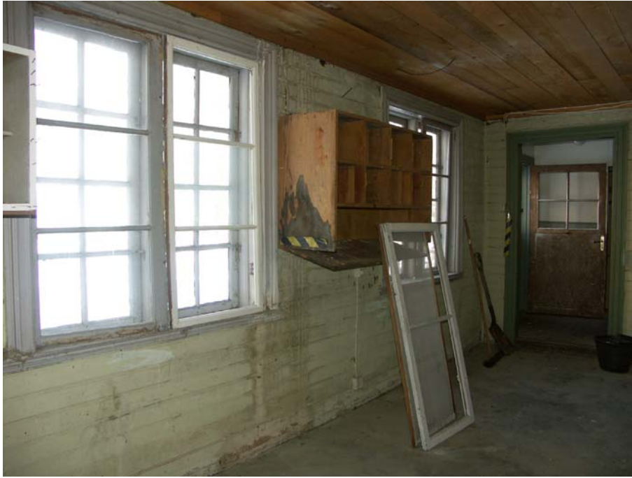
Rum i bottenvåningen med gjutet golv och liggande pärlspont på väggarna