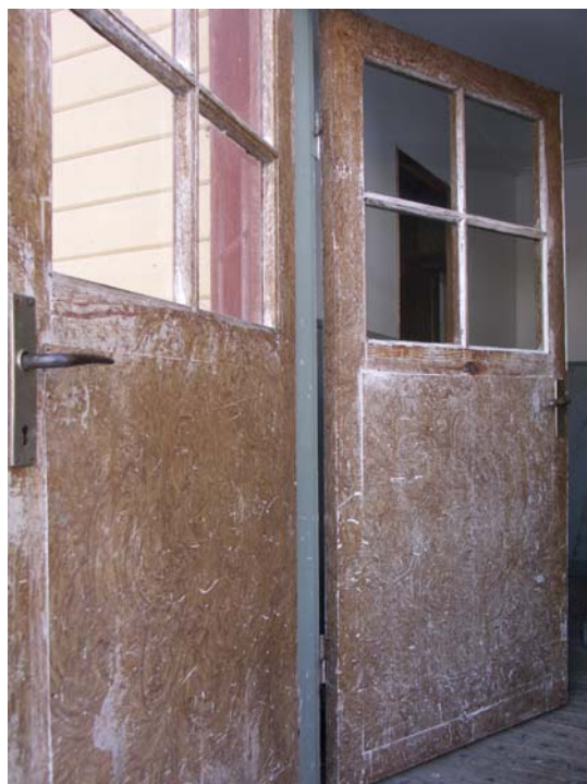
Ytterdörr respektive innerdörr tillhörande Ingång B. Enkel ådringsmålning på masonit