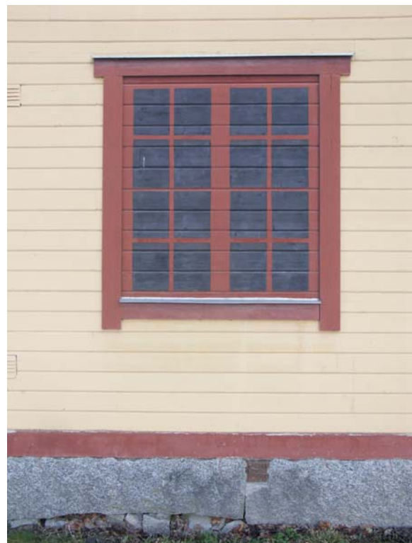
Blindfönster i bottenvåningen, V långsidan