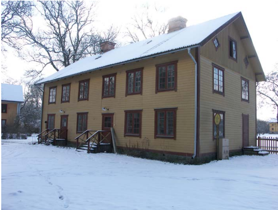
Alléhusets långsida mot Ö och gavel mot N. Fr v Ingång A, B och C

Byggnaden är uppförd med liggtimmerstomme i två våningar samt vind. Stommen vilar på en grund i huggen natursten i liggande block. Fasaden har en panel av liggande fasspont. I gavelröstena återfinns en locklistpanel. Fasspontpanel och locklistpanel är målade i en mörkt gul kulör. Alla snickerier som knutbrädor, fotbräda, taktassar, vindskidor, fönsterfoder, fönsterbågar är målade i en brunröd kulör. Fasaderna målades senast om 1994.