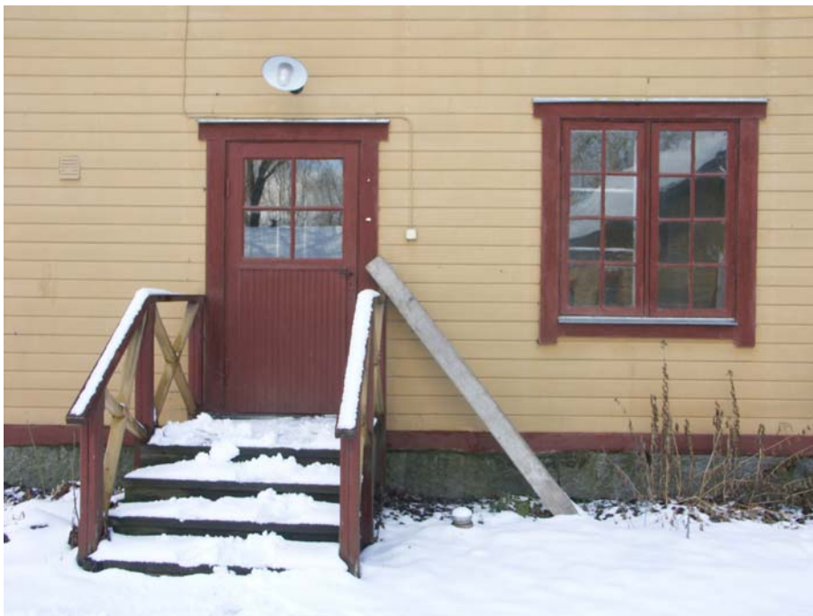
Dörr tillhörande Ingång B, och fönster som föreslås byta plats vid ombyggnad

Bergvärme med golvvärme installeras för att ge ett bättre och mer ekonomiskt inomhusklimat.