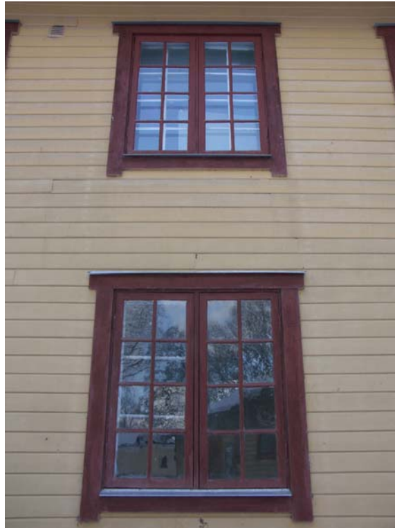
Fönsterbågar i två lufter med åtta rutor i ytterbågarna och skiftande spröjsar i innanfönstren

Fönsternas ytterbågar har två lufter med vardera åtta rutor. De lösa innanfönstren har varierad spröjsning; en del med samma täta spröjsning som ytterbågarna, en del med glesare spröjsning. På långsidan mot vägen och väster finns två blindfönster i liggande fasspont, ett i bottenvåningen och ett i övervåningen. I vardera gavelröstet återfinns två rombeställda mindre fönster, försedda med fyra rutor.