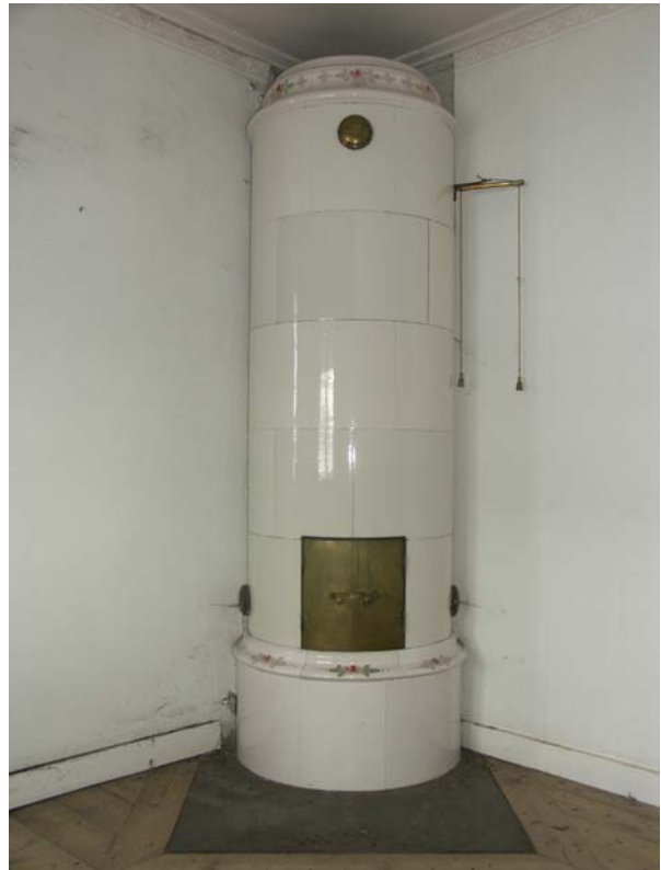
Vitglaserad kakelugn med stiliserade blommotiv