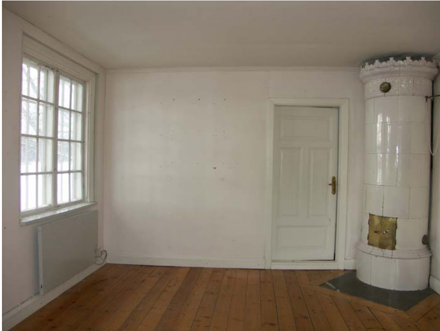
Rum med kakelugn innanför köket och långsidan mot väster