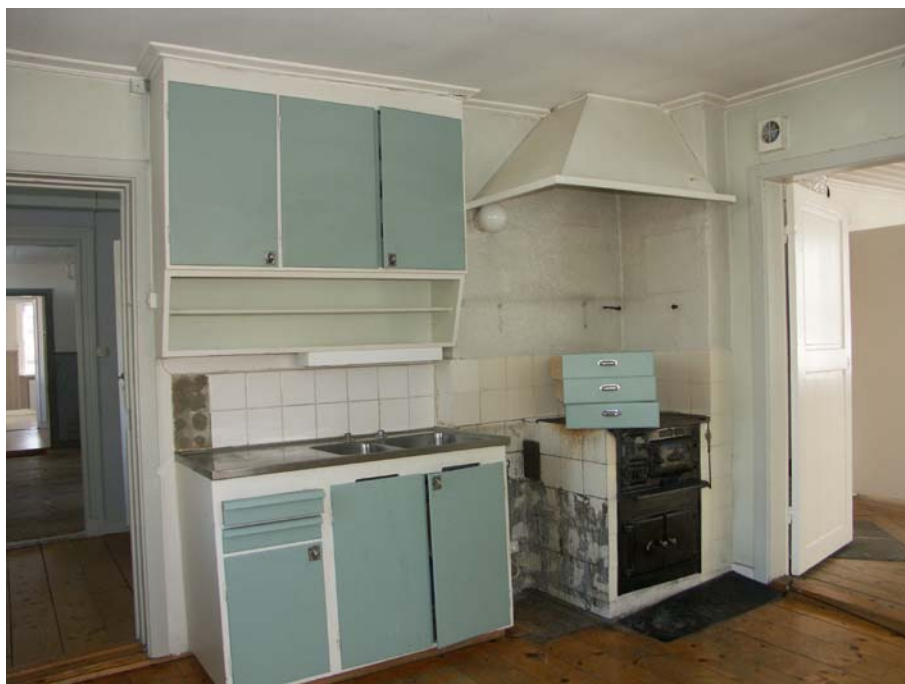
Kök innanför gaveln mot N med järnspis och spiskåpa i det inre hörnet