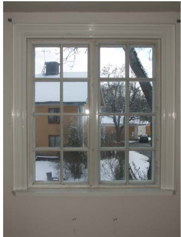
Fönster på övervåningens S gavel. Identisk spröjsning på ytterbåge och innanfönster. Innanfönstret låses med innanfönsterskruv. De profilerade fönsterfoderna är bevarade.