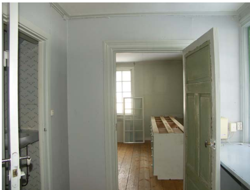
Hall med kök i bakgrunden, bevarade profilerade fönster- och dörrfoder

Det inre rummet innanför långsidan mot väster har samma kakelugn som det yttre rummet. Rummet har sekundära fönsterfoder.