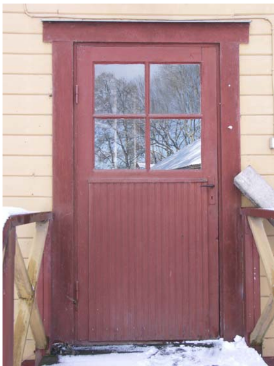
Sekundär dörr tillhörande Ingång B