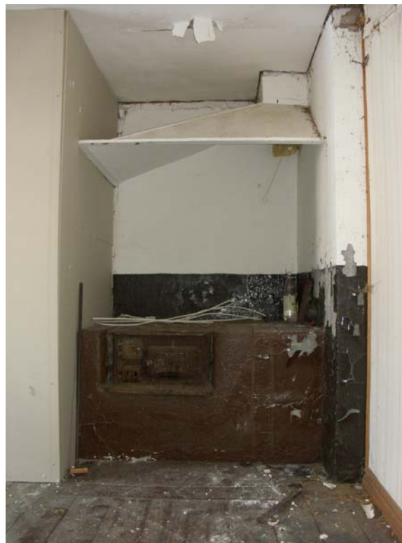
Förmodad sekundär och återbrukad dörr mellan kök och sekundär gång under trappa Järnspis och spiskåpa i kökets inre hörn