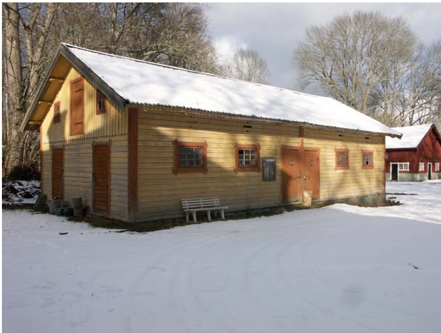
Uthuset och ladugården öster om Alléhuset