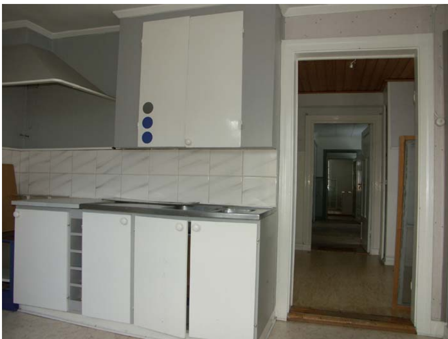
Köket med spiskåpa i plåt i det inre hörnet, hall och trapphall i bakgrunden