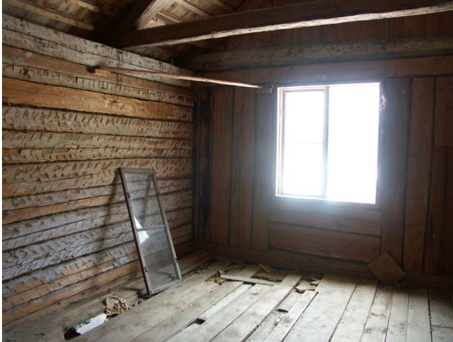
Oinredd vindskammare innanför gaveln mot N