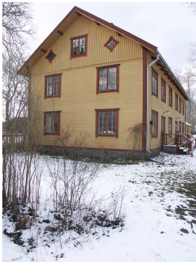
Alléhusets gavel mot S och långsida mot Ö

Byggnaden uppfördes för lantarbetarfamiljer anställda på Örbyhus gods. Byggnaden var in på 1980-talet bebodd av anställda under godset. Övervåningen har varit bebodd fram till för ett par år sedan, medan bottenvåningen sedan länge stått oanvänd. Köket innanför bottenvåningens södra gavel används dock som lunchrum etc. av godsets parkarbetare.