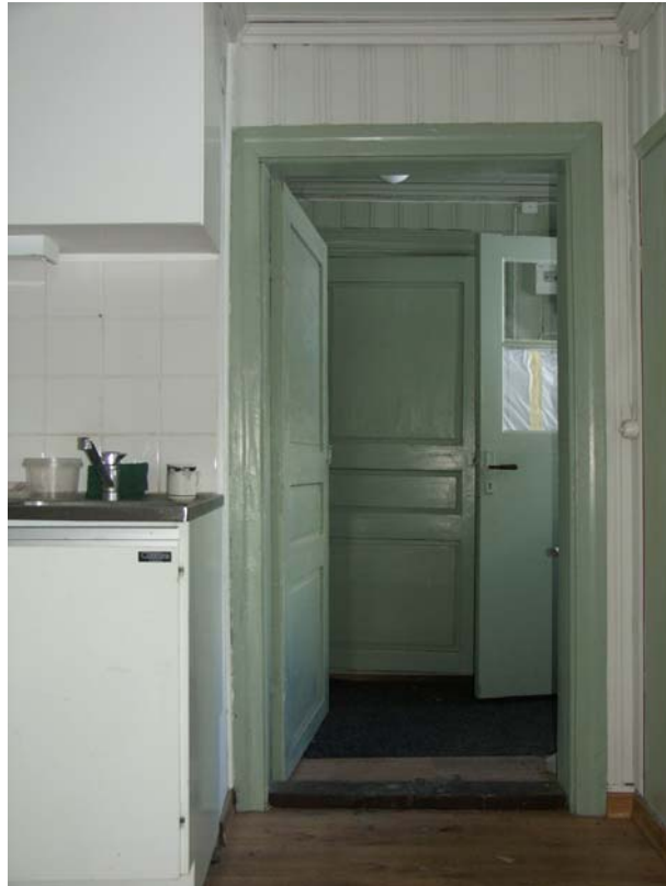
Vy från köket ut mot förstugan och ytterdörren