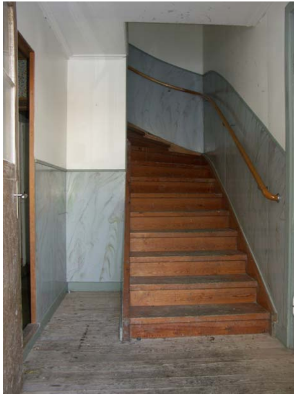
Förstuga och trappa upp till övervåning och vind

På insidan av ytterdörren och innerdörren återfinns en enkel ådringsmålning på dörrbladens masonitskivor. Väggarna i förstugan och i trapphuset till övervåningen är skivtäckta och är försedda med en marmoreringsmålning. Den förmodade sekundära och ombyggda trappan leder upp till vad som idag är en hall i övervåningen.