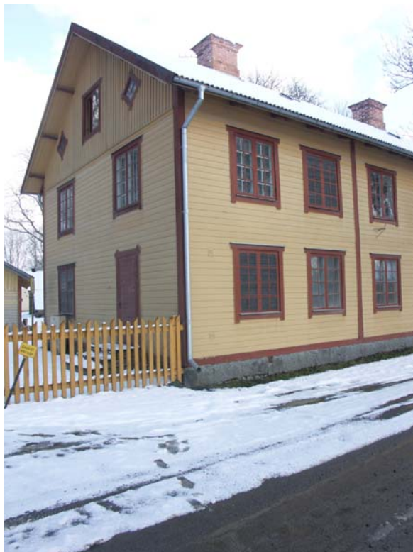
Blindfönster i bottenvåningen respektive övervåningen, långsidan mot V