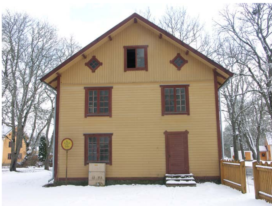
Alléhusets norra gavel med Ingång C till lägenhet innanför gaveln