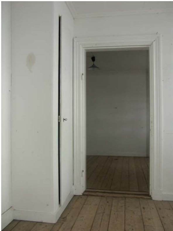
Frilagda trägol i kök och rum, profilerade foder