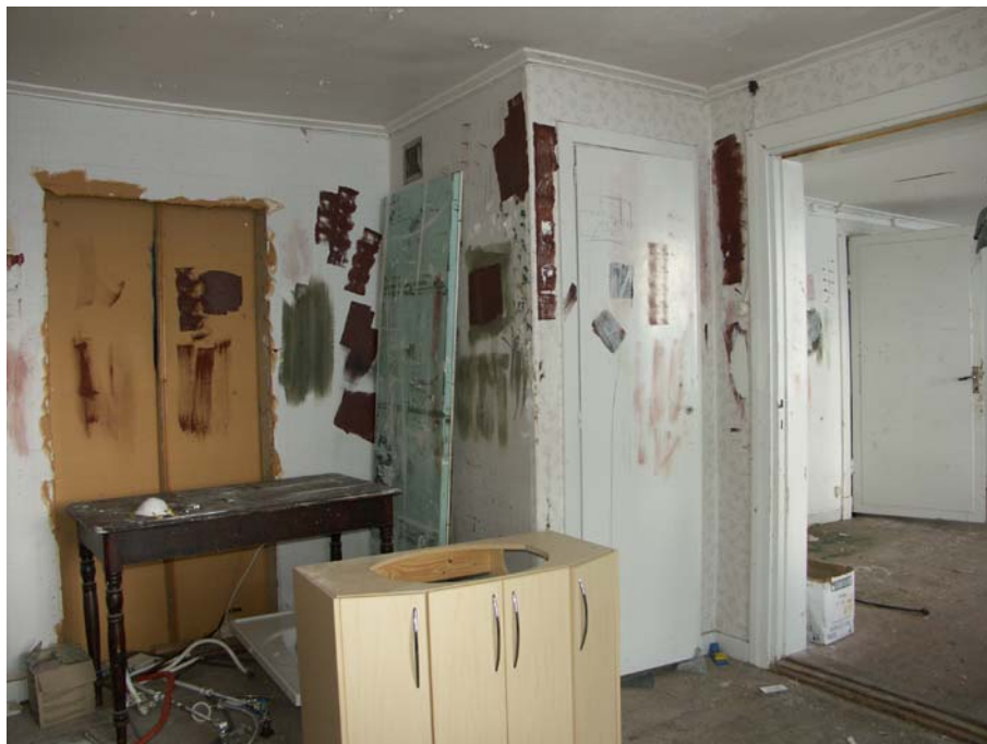
Det inre av lägenhetens två rum. Tv igensatt dörr mot intilliggande lägenhets kök, th tillbyggd garderob på platsen för tidigare kakelugn