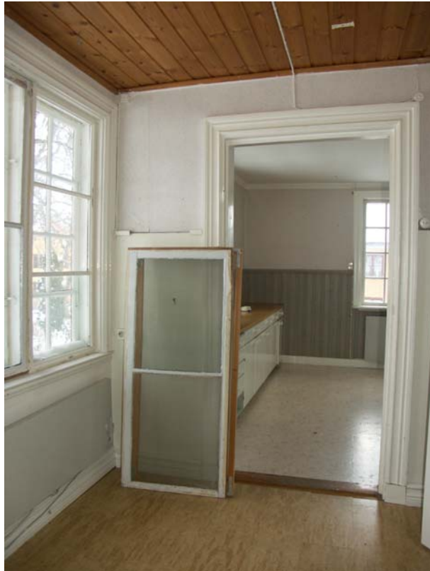
Hall med kök i bakgrunden, bevarade profilerade fönster- och dörrfoder