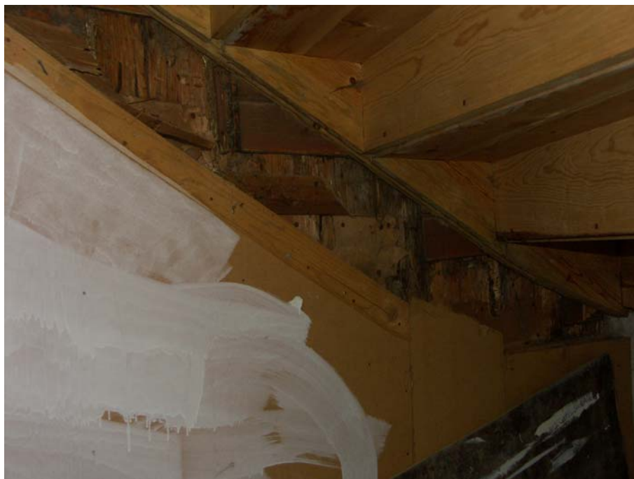
Eventuella spår av tidigare trappa under befintlig trappa innanför Ingång B