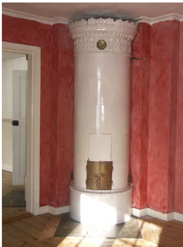
Inre rum med kakelugn och frilagt trägolv