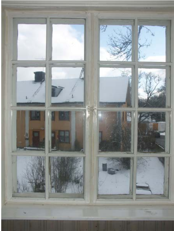
Fönster på övervåningens S gavel. Identisk spröjsning på ytterbåge och innanfönster. Innanfönstret låses med fällbomsbeslag. De profilerade fönsterfoderna är borttagna.