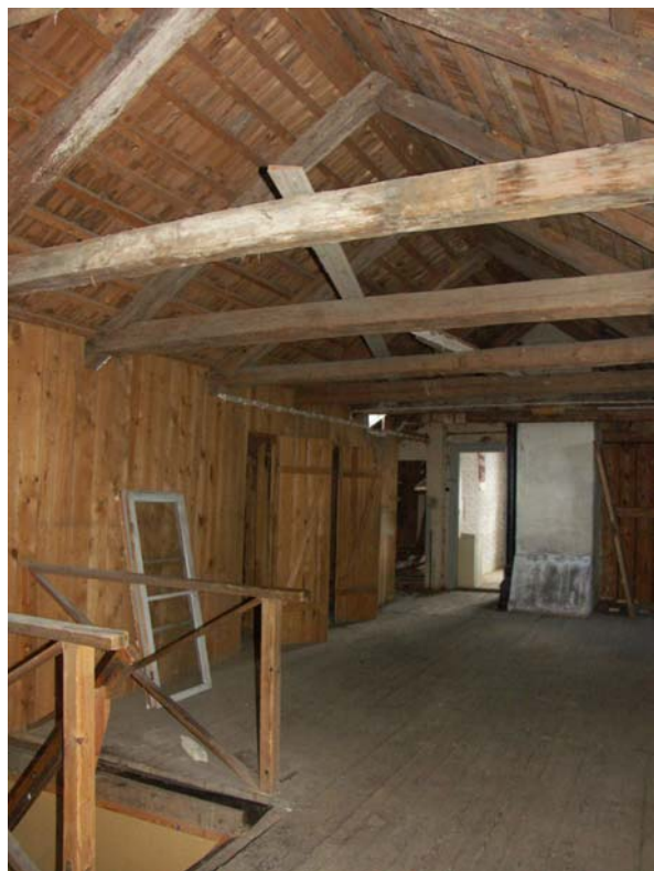
Vindsåvåningen med takstolar och stickspånstak

Ett möjligt embryo till inredd kammare finns innanför gaveln mot norr.