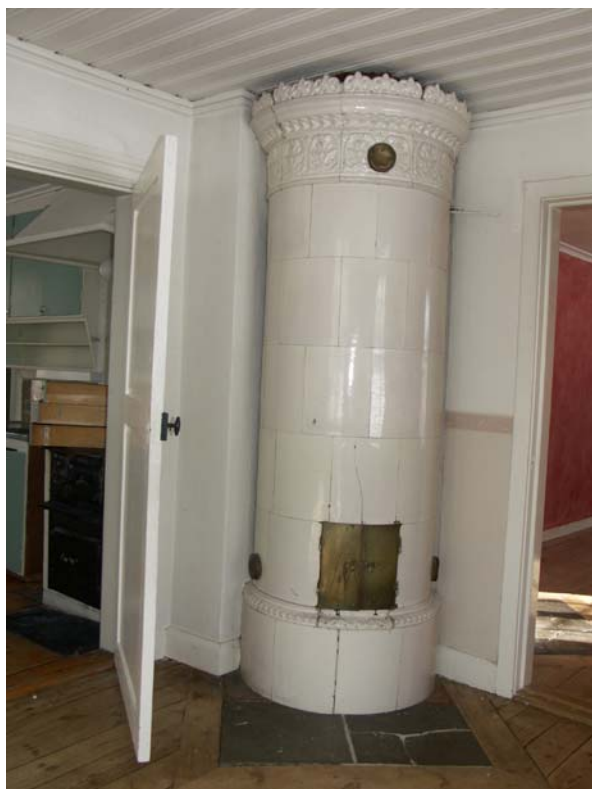
Yttre rum med kakelugn och frilagt trägolv