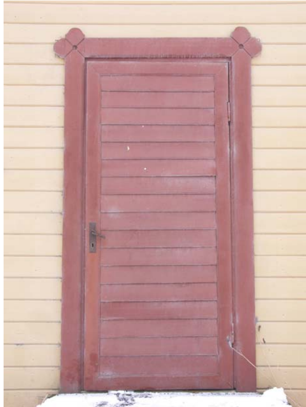
Dörr med liggande panel och profilerade foder, gaveln mot N