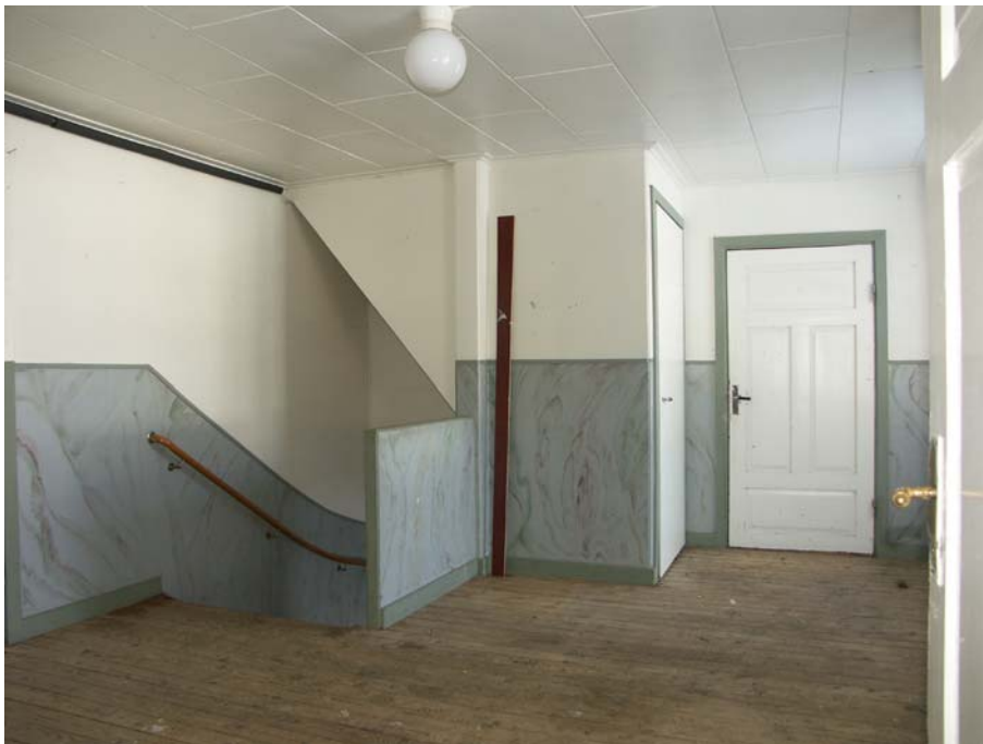
Sekundär trapphall på övervåningen, med dold trappa upp till vinden