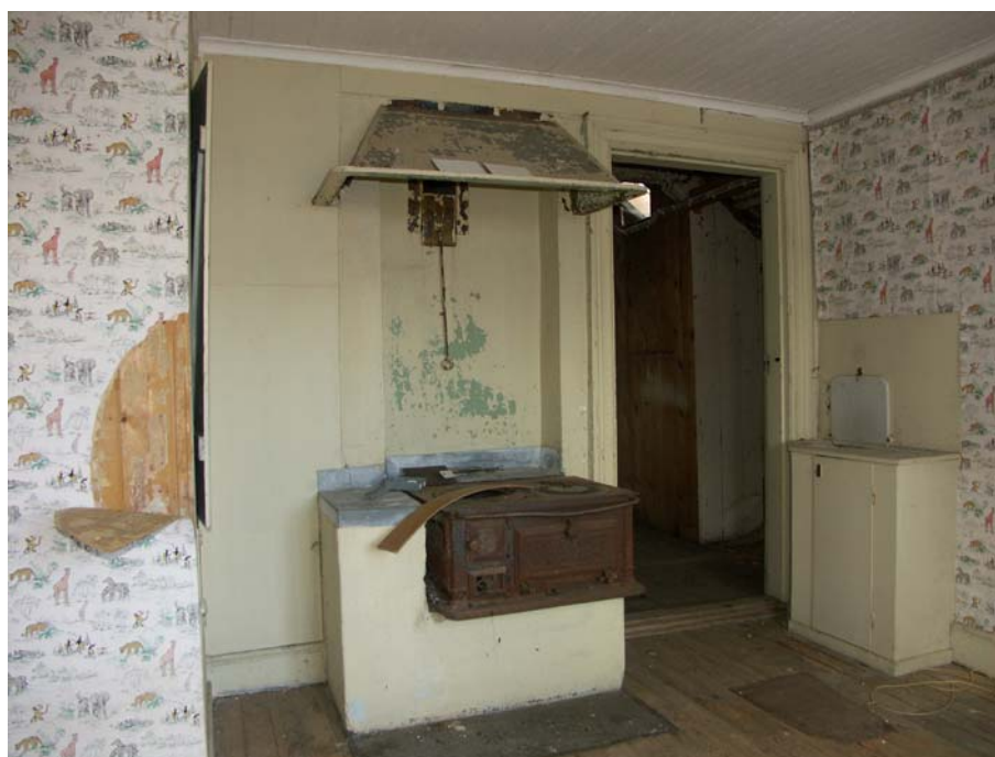
Inrett spisrum i vindskammare innanför gaveln mot S