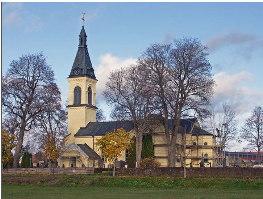
Vänge kyrka efter fasadrestaurering

Fasad och sockel på Vänge kyrka har rengjorts, putslagats och avfärgats med KEIM Purkristalat silikatfärg.