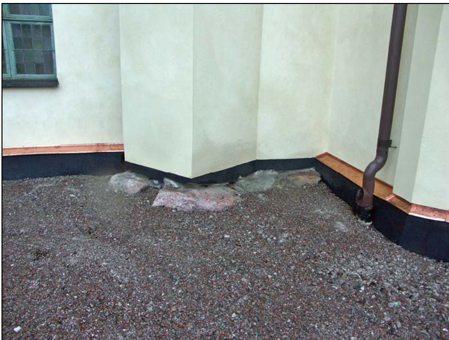
En av strävpelarna i den östra delen av kyrkan står på synliga grundstenar. Putsning utfördes med något släpp från grundstenarna.