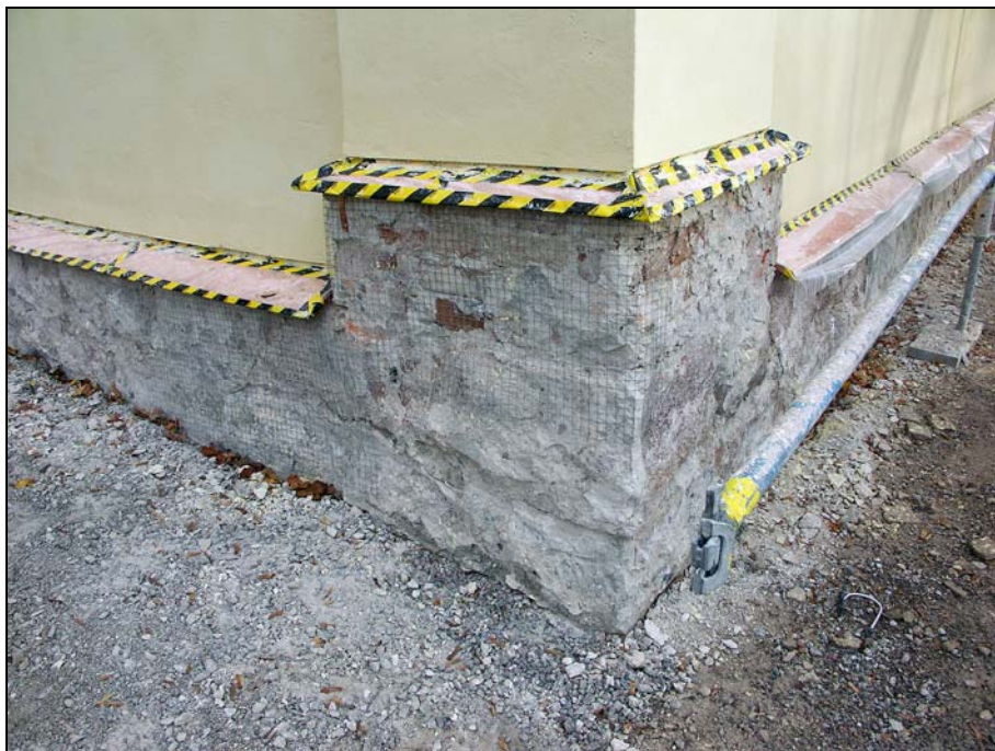
Sockeln vid kyrkans sydöstra hörn efter friläggning, utförande av kopparavtäckning samt nätning.