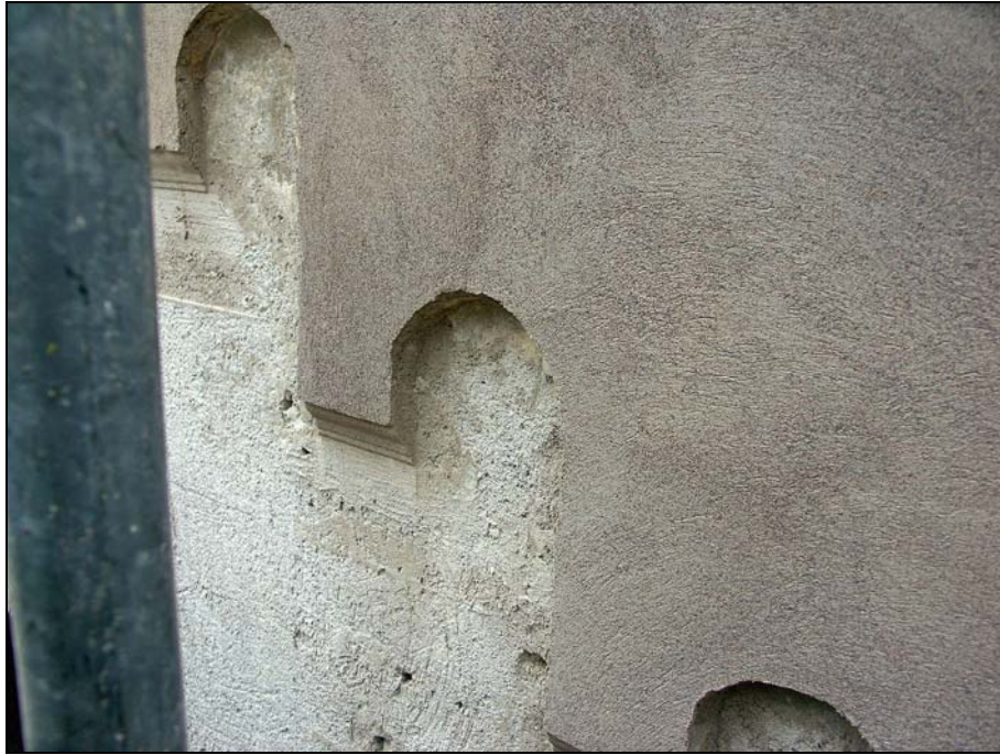
Vapenhusets gavelspets. Ny putsad rundbågefris med profilerad nederkant likt befintlig har utförts på skadade partier.