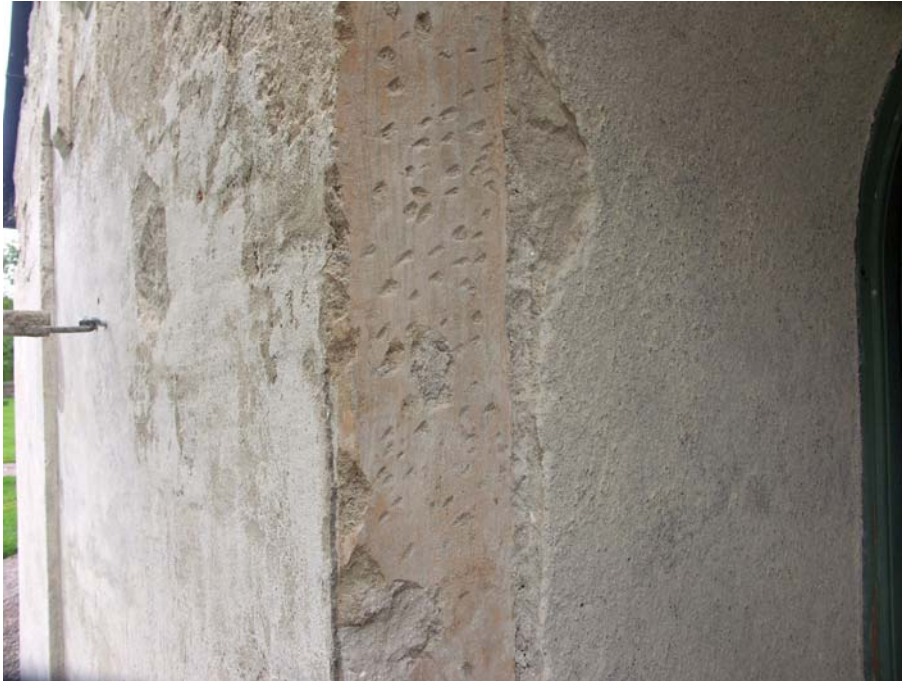
Vapenhuset port hade tidigare en slätputsad om- fattning, avfär- gad i en ljus gulröd färg