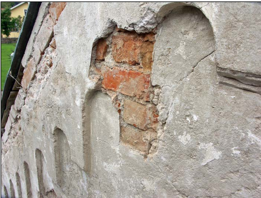
Vapenhusets gavelspets efter rengöring.