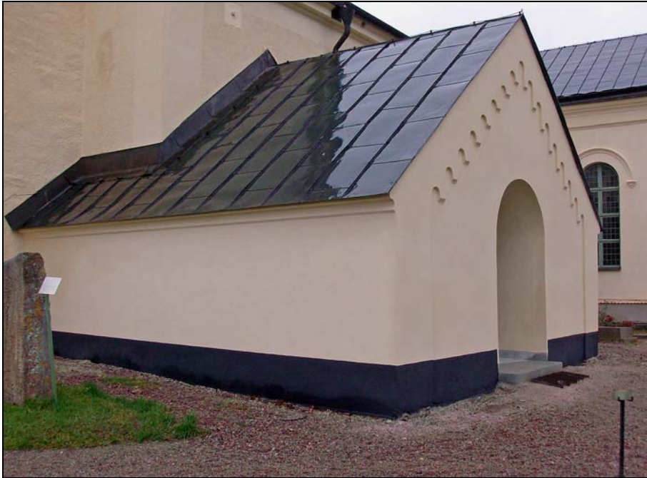
Vapenhuset efter genomförd restaurering.