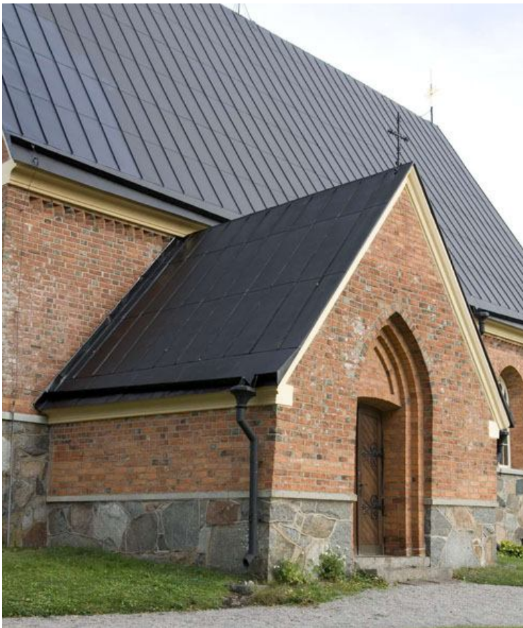
Vapenhuset med nytt plåttak. Mönstret från den gamla skivtäckningen har behållits. DIG008301