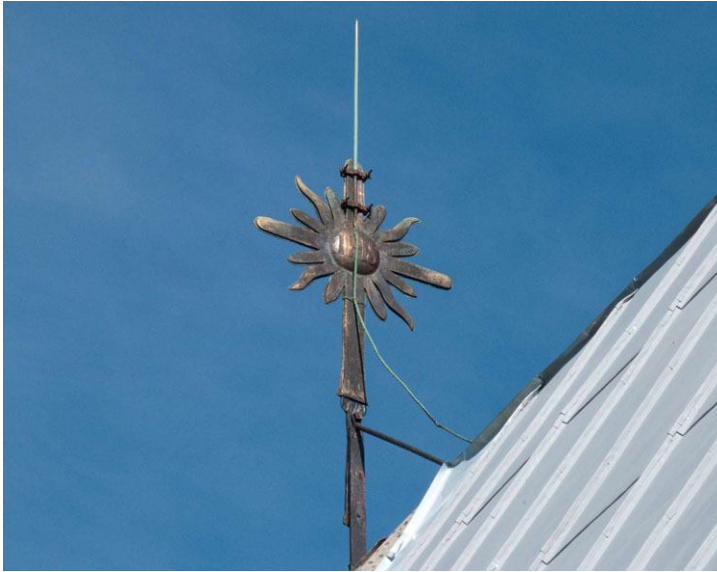
Takdekorationerna på långhuset togs ner och omförgylldes. Här ses det västra korset före och efter förgyllning. DIG005309, till vänster, DIG008306, nedan.