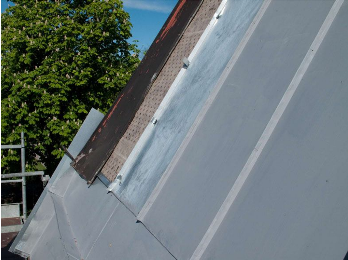
Plåten enkelfalsas lika tidigare. Den borte skivan är kvar från den gamla plåten men byttes när ställningen flyttades till västra gaveln. Mellan den gamla och nya plåten ses underlagstäckningen. Den nya plåten är grundmålad med Pentur primer. DIG005312