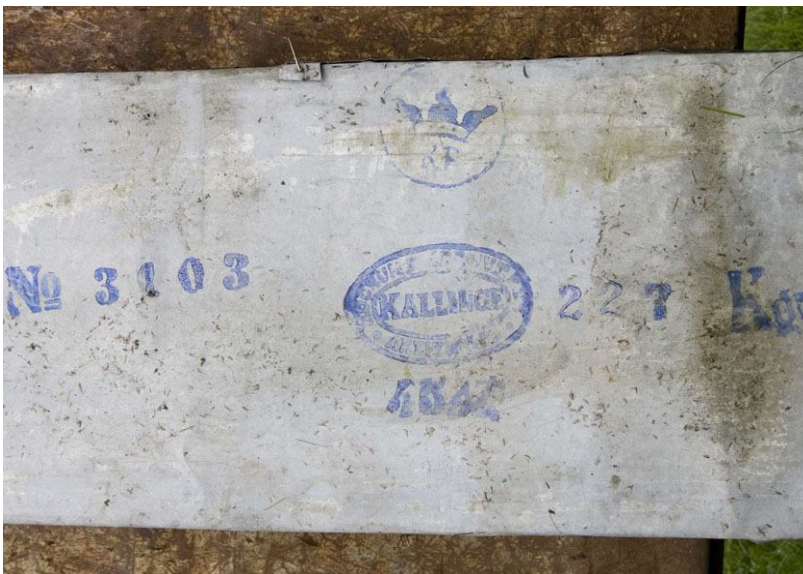
Den gamla galvaniserade plåten var stämplad vid Kallinge järnbruk på 1890-talet. DIG005659.