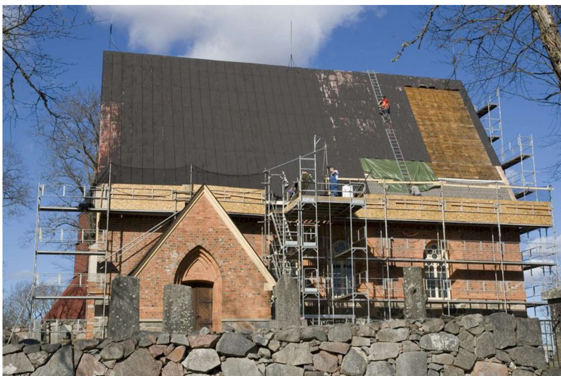
Södra långhustaket i början av april. Där skivtäckningen har rivits av syns brädunderlaget. DIG005432.