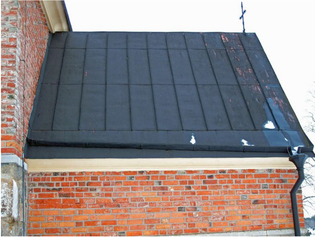
Vapenhusets gamla skivtäckning. DIG005027