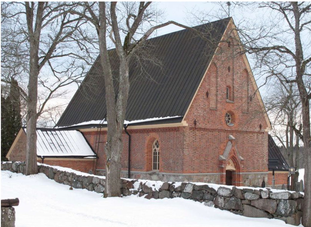
Vy från nordväst i mars 2009 medan den gamla skivtäckningen låg kvar. DIG005034.