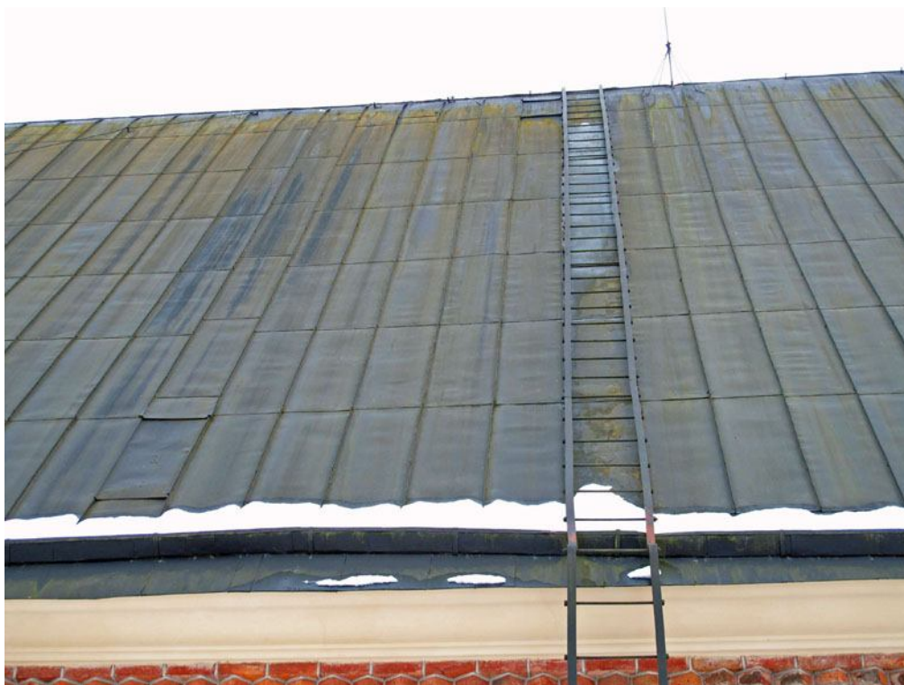
Norra långhustaket före renovering. Den gamla järnstegen har ej återmonterats efter takomtäckningen. DIG005033.