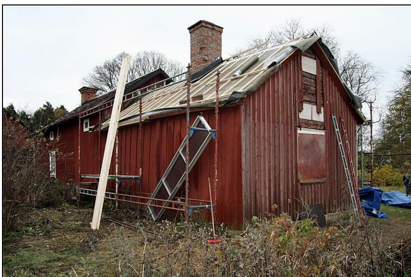
2010-10-26. Det nordöstra takfallet under pågående läkning.

Den gamla trätrummen mättes upp och en ny trumma i samma utförande tillverkades. Den nya trumman sattes upp på den gamlas plats.