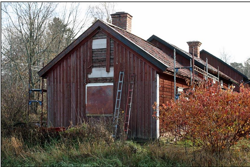
2010-11-01. Bryggghuset från väster efter restaurering.