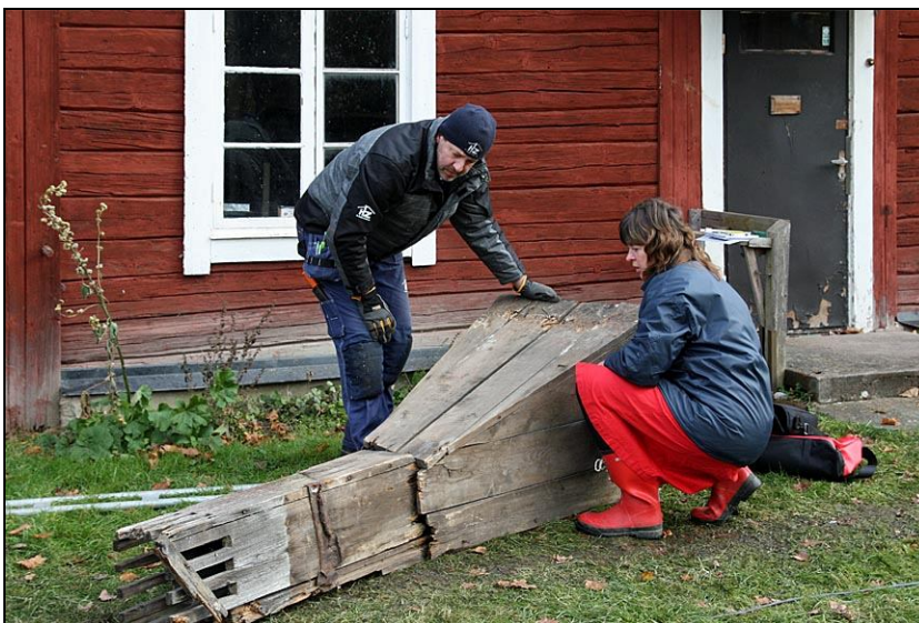
2010-10-26. Den gamla ventilationsstrumman inspekteras inför uppsättningen av den nya.