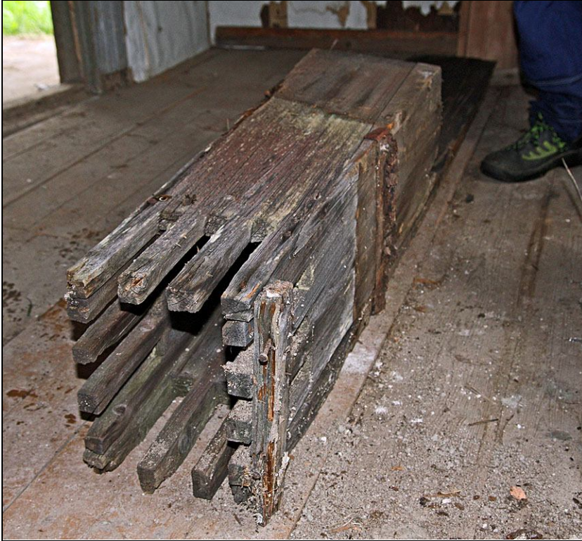
2010-10-22. Demon- terad ventilations- trumma för brygghu- set.