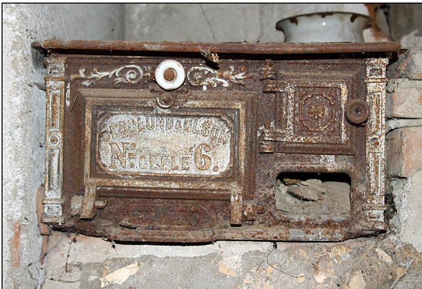
2010-10-22. Vedspis i drängkammaren, av fabrikat Skoglund och Olson i Gävle.

Både drängkammaren och bryggrummet inreddes förmodligen i samband med längans tillkomst. Väggarna i drängkammaren är klädda med stående pärlspontpanel som tycks vara brunbetsad. På panelen har man limmat tidningspapper som underlag för tapeter. Det understa lagret av tidningspapper är från 1933 och efter ett tapetlager kommer tidningar från 1944. I rummet finns en vedspis av fabrikat Skoglund och Olson i Gävle, no 6. Gjuteriet startade 1874 och med tanke på det låga modellnumret bör spisen vara från slutet av 1800-talet. Uppmurningen för vedspisen är inte murad i förband med murstocken och med tanke på eldstadsplanens utformning kan man tänka sig att spisen satts in i ett ganska sent skede. Drängkammarens plankgolv har vid tidigare tillfällen reparerats och lagts om.