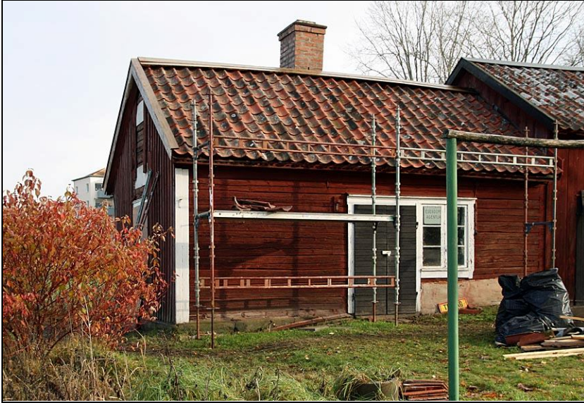
2010-11-01. Bryggghuset sydvästra fasad efter restaurering.