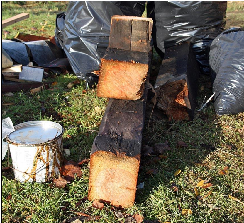
2010-11-01. Demonterade stockbitar från de gamla, angripna takbjälkarna. Stockarna tycks ha varit arsenikimpregnerade och förmodligen behandlade med kresot.