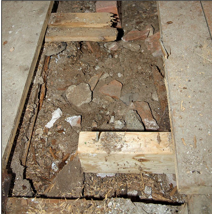
2010-08-10. Drängkammarens brädgolv med två borttagna bräder. Sentida bär-linor av byggreglar visar att golvet har reparerats i sen tid, men det finns också äldre lagningar. Delvis tycks dagens brädgolv ha lagts ovanpå ett äldre, underliggande brädgolv.

Drängkammaren och brygghuset har sågade takbjälkar och ett fint profilerat undertak av falsade bräder lagda med botten och lock ovanpå takbjälkarna. Tidigare låg det en fyllning av vass ovanpå bräderna. Undertaket är vitlimmat i drängkammaren och svärtat i bryggrummet.