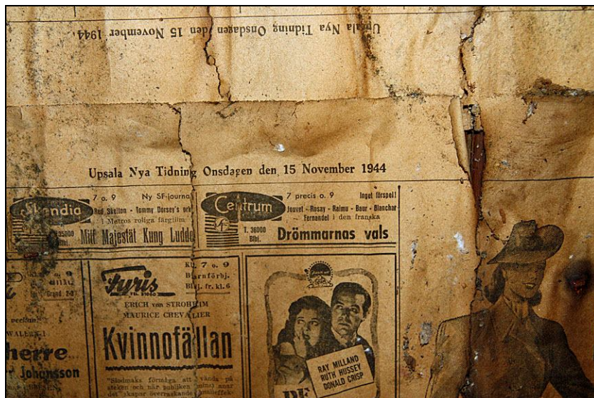
2010-08-10. Väggar-na i drängkammaren har klätts med tidningspapper.

Drängkammaren och brygghuset har sågade takbjälkar och ett fint profilerat undertak av falsade bräder lagda med botten och lock ovanpå takbjälkarna. Tidigare låg det en fyllning av vass ovanpå bräderna. Undertaket är vitlimmat i drängkammaren och svärtat i bryggrummet.