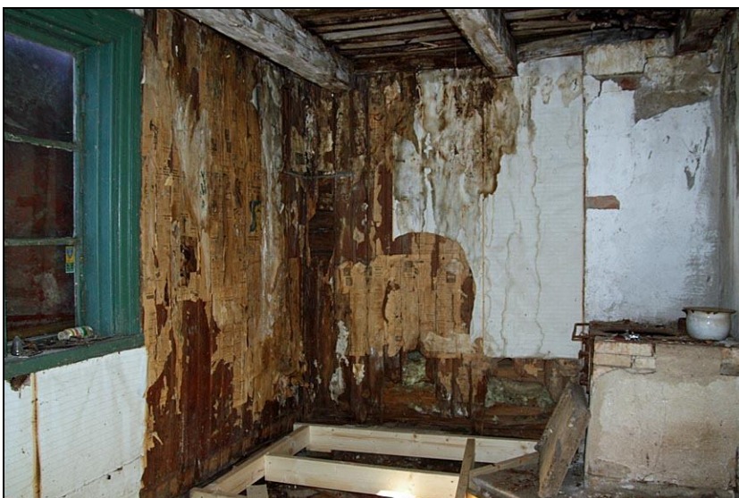
2010-10-22. Drängkammarens nordöstra hörn under pågående golvarbeten.