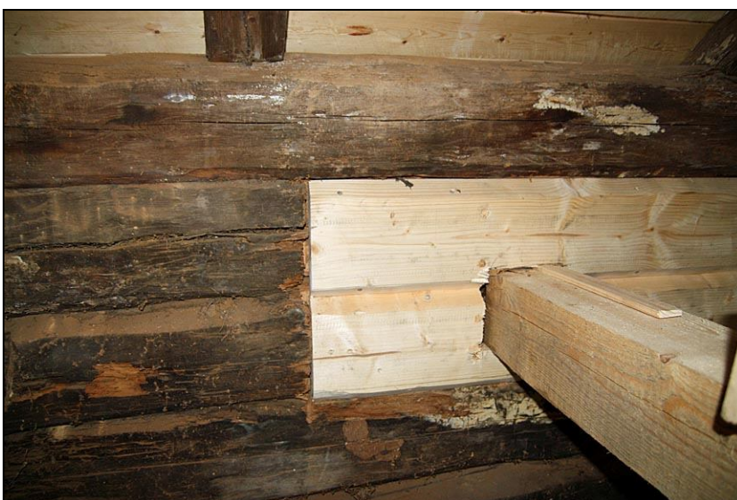
2010-11-01. Halvsulningar vid en av takbjälkarnas upplag i nordöstra långväggen.