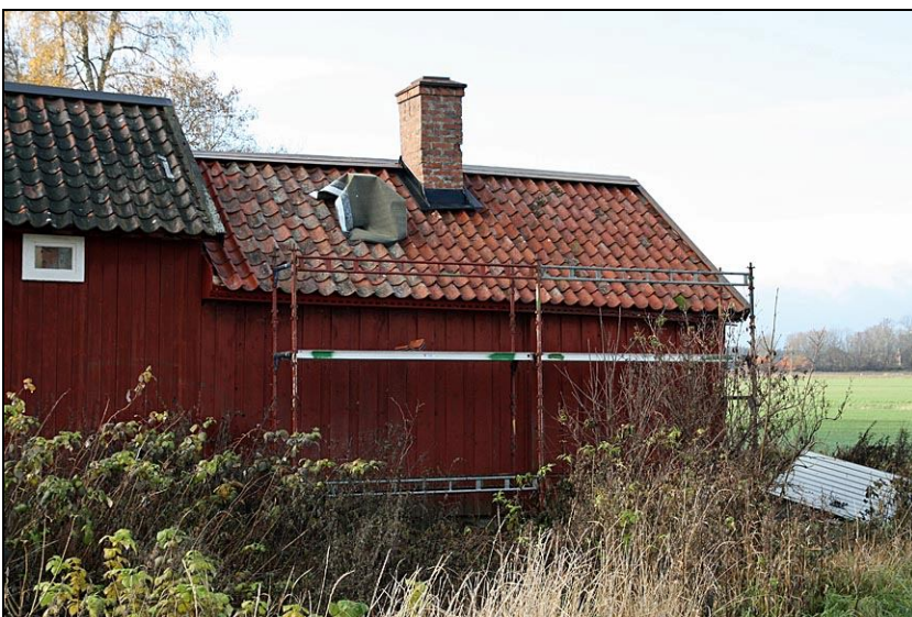
2010-11-01. Bryggghuset från öster efter restaurering.