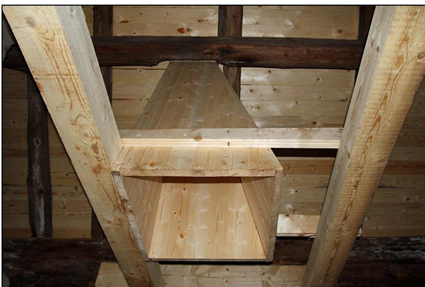
2010-11-01. Den nya ventilationstrumman monterad på de gamla platsen. Urtag i mitt-åsen visar trummans rätta position. Bjälkarna är nya.