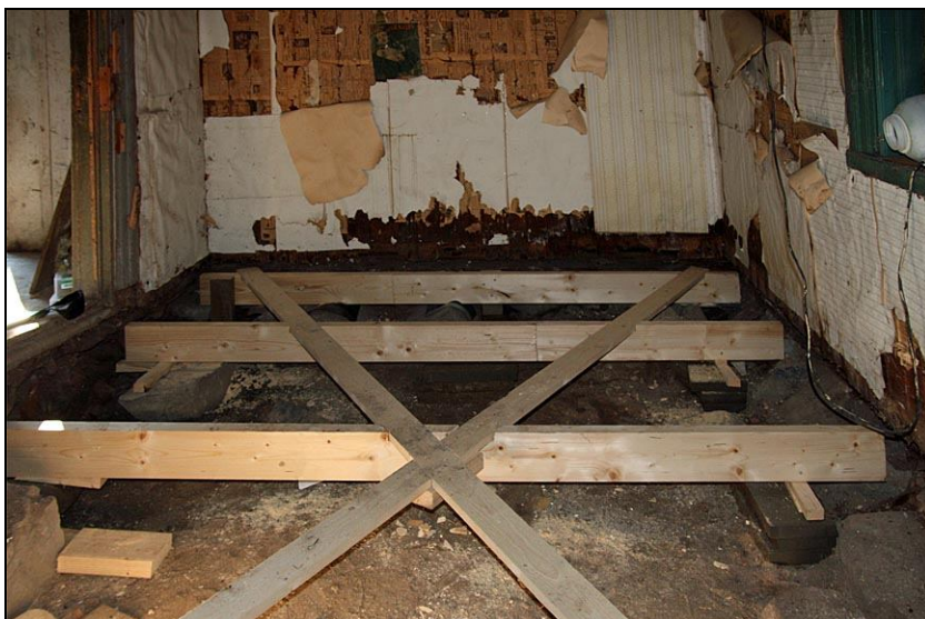
2010-10-22. Drängkammarens brädgolv har rivits ut och grunden har rensats från skräp och organiskt material. Nya bärlinor har satts upp.

Befintligt plankgolv demonterades, inklusive ruttna stockar och annat organiskt material. Grunden grävdes ur och bärlinor placerades på grundstenar. Bärlinorna isolerades mot stenarna med papp. Golvets lutning anpassades så långt som möjligt efter det gamla golvet och timmerstommens krökning. Ett nytt plankgolv av 45 x 220 mm plankor lades på bärlinorna.