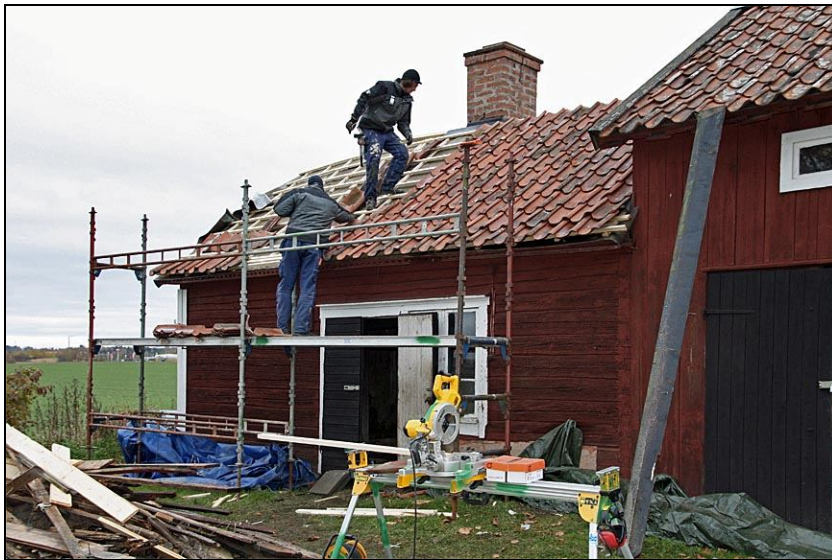
2010-10-26. De rengjorda tegelpannorna återmonteras på det sydvästra takfallet.