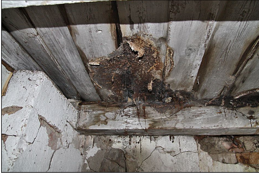
2009-10-22. Uttorkad fruktkropp ovanför drängkammarens vedspis. Innan restaurering.