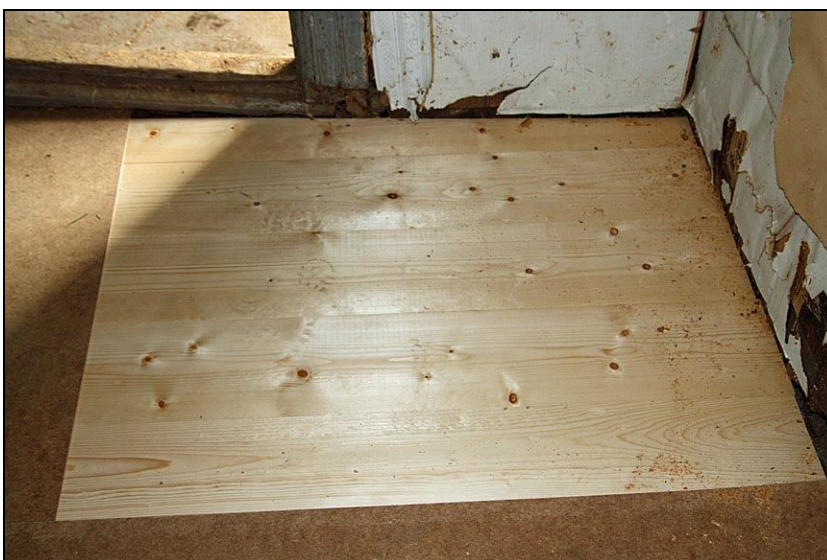
2010-11-01. Det nya plankgolvet av 45 x 220 mm plank lagt på bärlinorna.