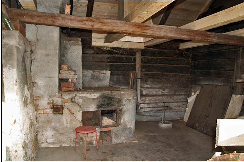
2010-11-01. Bryggerummet med demonterat innertak, nya takbjälkar och ny ventilationstrumma.