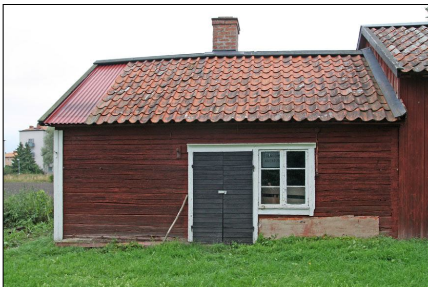
2010-08-10. Sydvästra fasaden innan restaurering.

Brygghuset är förmodligen uppfört under senare hälften av 1800-talet och har i ett senare skede, förmodligen kring sekelskiftet 1900, införlivats i en ekonomilänga som förutom brygghuset med dess kammare också innefattar vedbod och kuskbostad. Brygghuset var tidigare försett med lunettfönster på båda gavlarna, där den ena gaveln idag är brädfodrad och den andra stöter mot vedbodens vägg. På båda gavlarna finns fönster, men fönstret mot vedboden har satts igen. Knutarna är släta och utförda med knäppen, en knuttyp som blev vanlig på ytterknutar under senare delen av 1800-talet men som är känd åtminstone sedan 1700-talet. Taklaget består av kroppås och sidoåsar som bär sparrar. Konstruktionen tyder på att det har suttit bräder tvärs takets fallriktning, möjligen under en täckning av näver och torv. Tvärs sparrarna satt bärläkt och på denna låg ett geltak på öppen läkt.