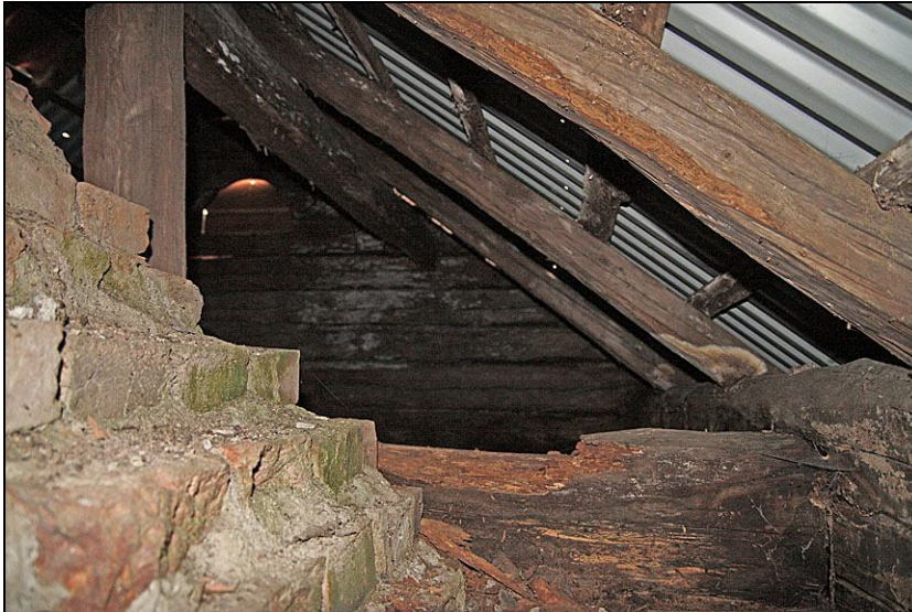
2010-08-10. Murstock och taklag på det nordöstra takfallet innan restaurering.

Både drängkammaren och bryggrummet inreddes förmodligen i samband med längans tillkomst. Väggarna i drängkammaren är klädda med stående pärlspontpanel som tycks vara brunbetsad. På panelen har man limmat tidningspapper som underlag för tapeter. Det understa lagret av tidningspapper är från 1933 och efter ett tapetlager kommer tidningar från 1944. I rummet finns en vedspis av fabrikat Skoglund och Olson i Gävle, no 6. Gjuteriet startade 1874 och med tanke på det låga modellnumret bör spisen vara från slutet av 1800-talet. Uppmurningen för vedspisen är inte murad i förband med murstocken och med tanke på eldstadsplanens utformning kan man tänka sig att spisen satts in i ett ganska sent skede. Drängkammarens plankgolv har vid tidigare tillfällen reparerats och lagts om.