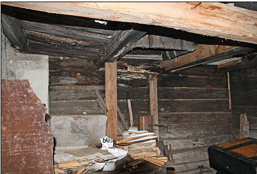
2009-10-22. Brygg- husrummet innan demonteringen av ventilationstrum- man.

Byggnaden hade innan restaureringen omfattande angrepp av svamp. Sporanalys visade att det inte var den fruktade hussvampen utan den mer lätthanterliga källarsvampen.