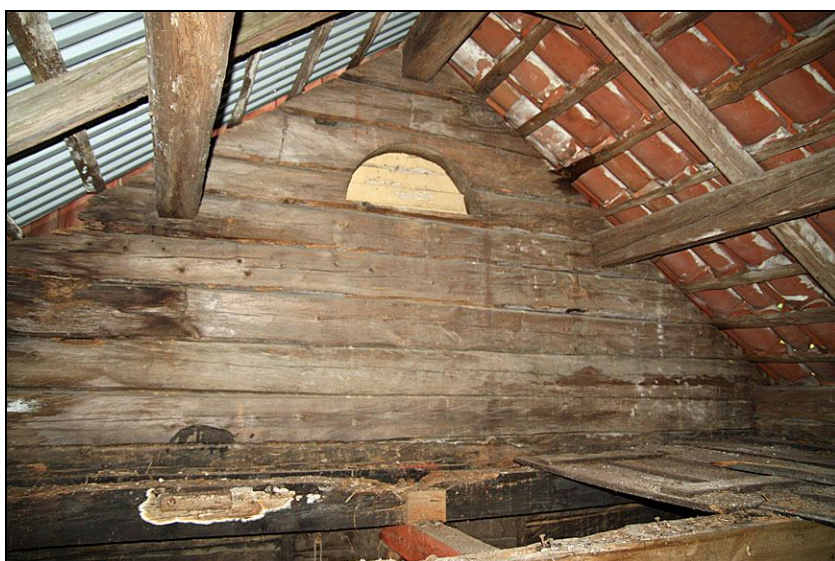
2010-08-10. Taklag och yttertak innan restaurering. På sydvästra takfallet ligger enkupigt tegel på öppen läkt. På nordöstra takfallet sitter ett tillfälligt skyddstak av trapets-korrugerad plåt. Lunettfönstret på det södra gavelröstet är igensatt med bräder.

Brygghuset är förmodligen uppfört under senare hälften av 1800-talet och har i ett senare skede, förmodligen kring sekelskiftet 1900, införlivats i en ekonomilänga som förutom brygghuset med dess kammare också innefattar vedbod och kuskbostad. Brygghuset var tidigare försett med lunettfönster på båda gavlarna, där den ena gaveln idag är brädfodrad och den andra stöter mot vedbodens vägg. På båda gavlarna finns fönster, men fönstret mot vedboden har satts igen. Knutarna är släta och utförda med knäppen, en knuttyp som blev vanlig på ytterknutar under senare delen av 1800-talet men som är känd åtminstone sedan 1700-talet. Taklaget består av kroppås och sidoåsar som bär sparrar. Konstruktionen tyder på att det har suttit bräder tvärs takets fallriktning, möjligen under en täckning av näver och torv. Tvärs sparrarna satt bärläkt och på denna låg ett geltak på öppen läkt.