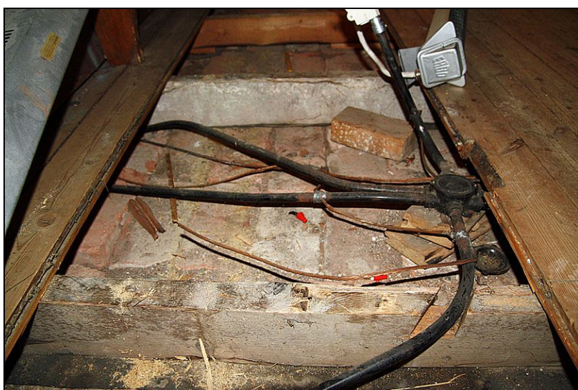
2010-09-27. I ett av facken fanns elinstallationer med stålrör, möjligen från restaureringen 1929.