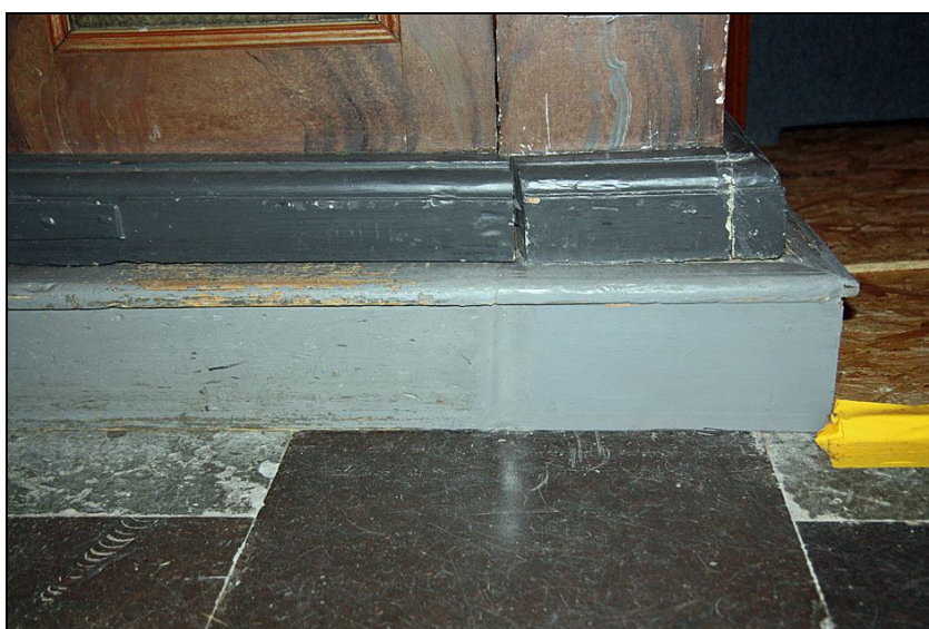
2010-11-23. Sockeln har anpassats och den avslipade delen har målats in i samma färg som omgivande sockel.