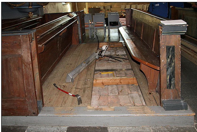
2010-09-27. Bänk nr 2 har demonterats liksom underliggande brädgolv från 1929.