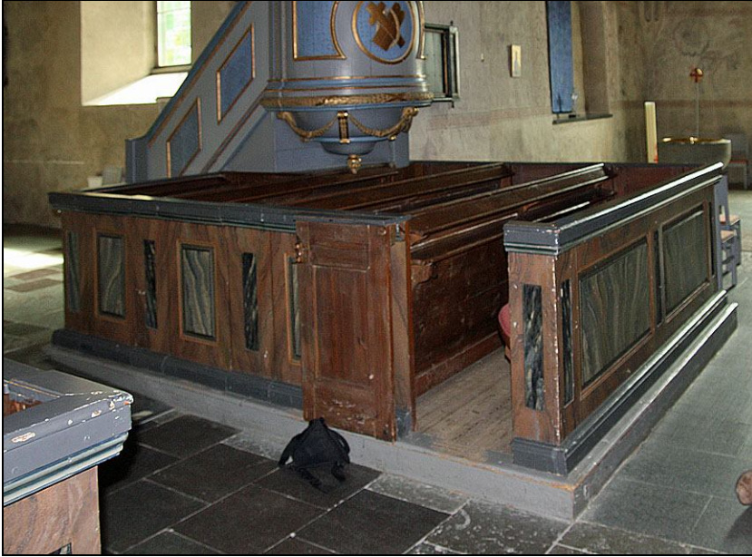
2010-06-09. Bänk- kvarteret innan åtgärd.