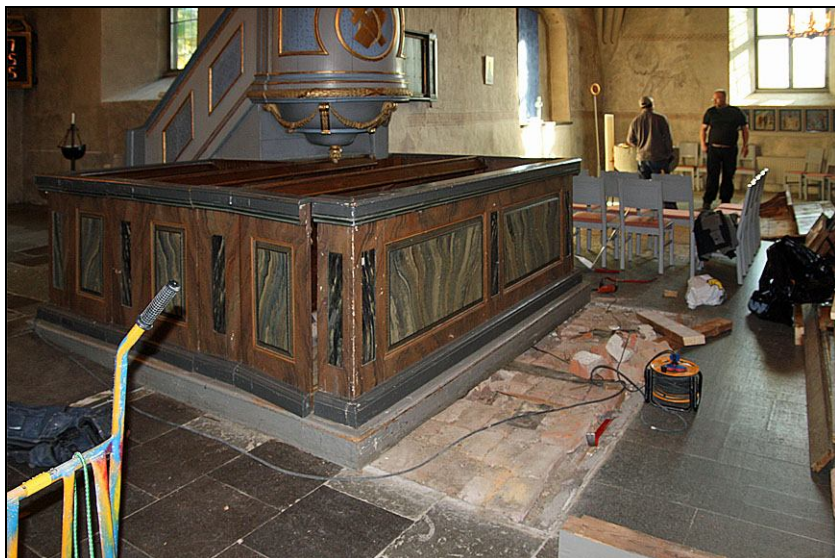
2010-09-28. Bänk nr 1 har flyttats fram så att den möter bänk nr 3.