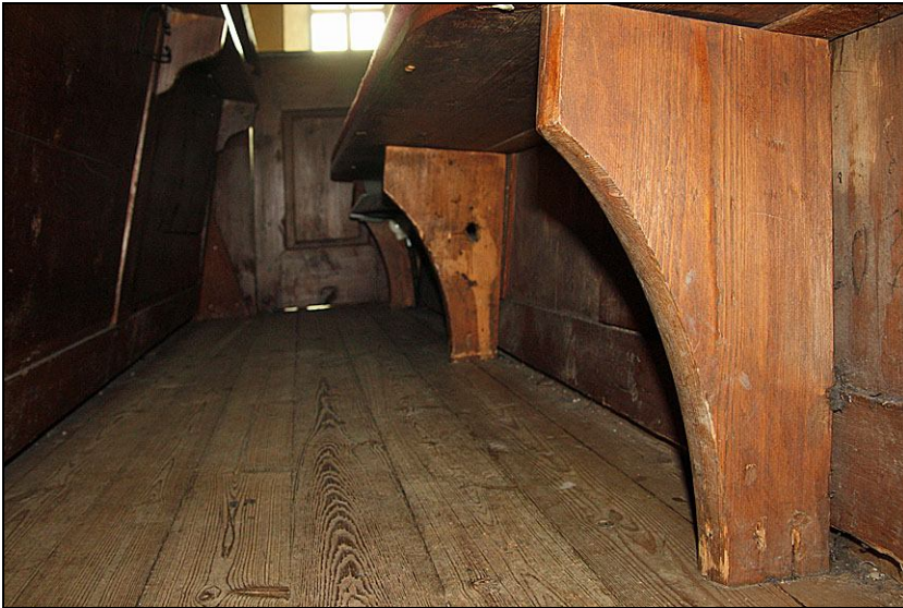
2010-06-09. Bänk- kvarteret innan åtgärd. Bänk nr 1.