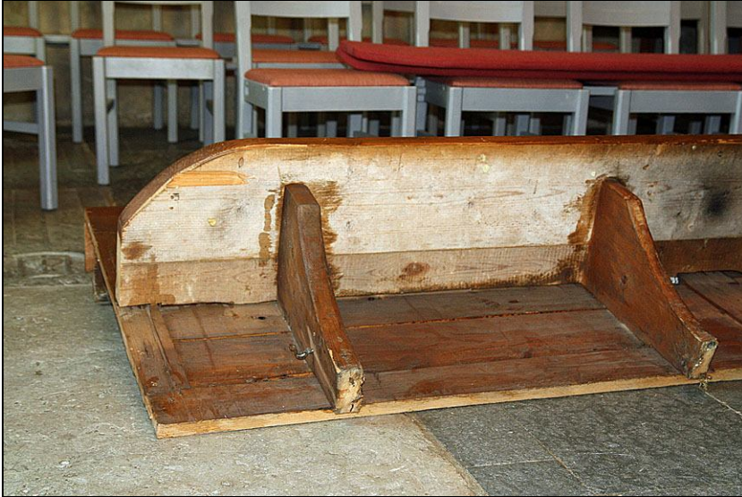
2010-09-27. Bänk nr 2 efter demonte- ring. Sittbrädan har en sågad un- dersida.