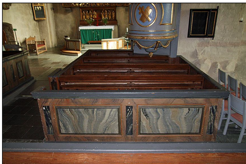
2010-06-09. Bänk- kvarteret innan åtgärd.