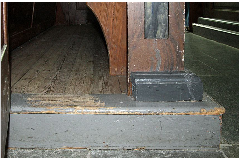
2010-06-09. Bänk- kvarteret innan åtgärd. Sockel till bänk nr 1.