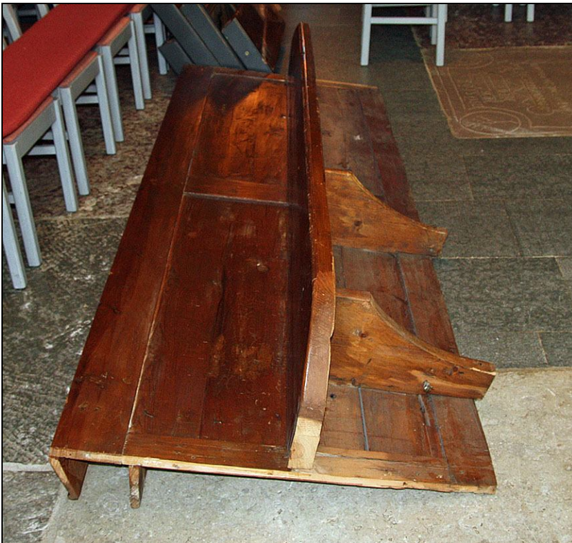
2010-09-27. Bänk nr 2 efter demonte- ring.