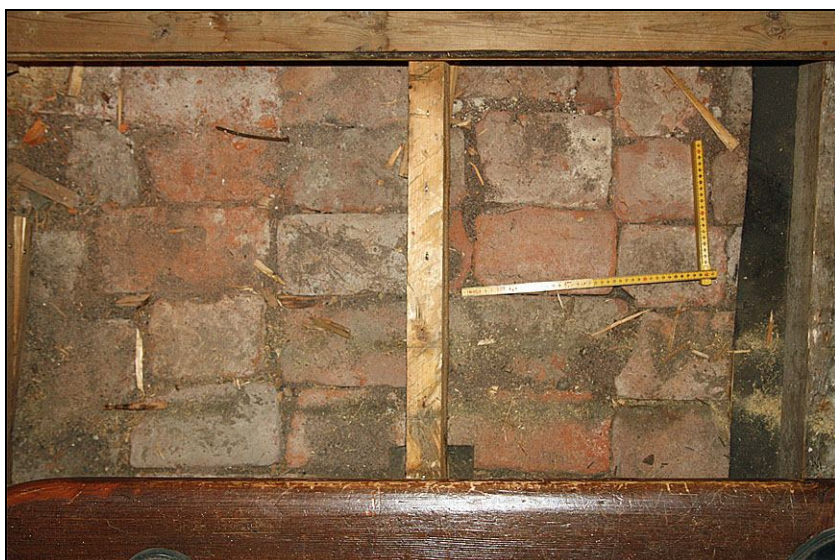
2010-09-27. Brädgolvet låg på bärlinor av sågade 2"4 regler. Bärlinorna låg i sin tur på ett undergolv av tegel, löst satt i sand. Undergolvet är inte lagt i förband och helsten, 1/2-sten och 3/4-sten blandas. Teglet är handslaget, ca 32 x 13,5 x 8,5 cm och har spår av kalkbruk på undersidan. Troligen har tegelstenarna återanvänts när det medeltida tegelstensgolvet bröts upp och ersattes av kalkstensplattor. Tegelstenarna är av samma utförande som de som ligger som golv i sakristian.