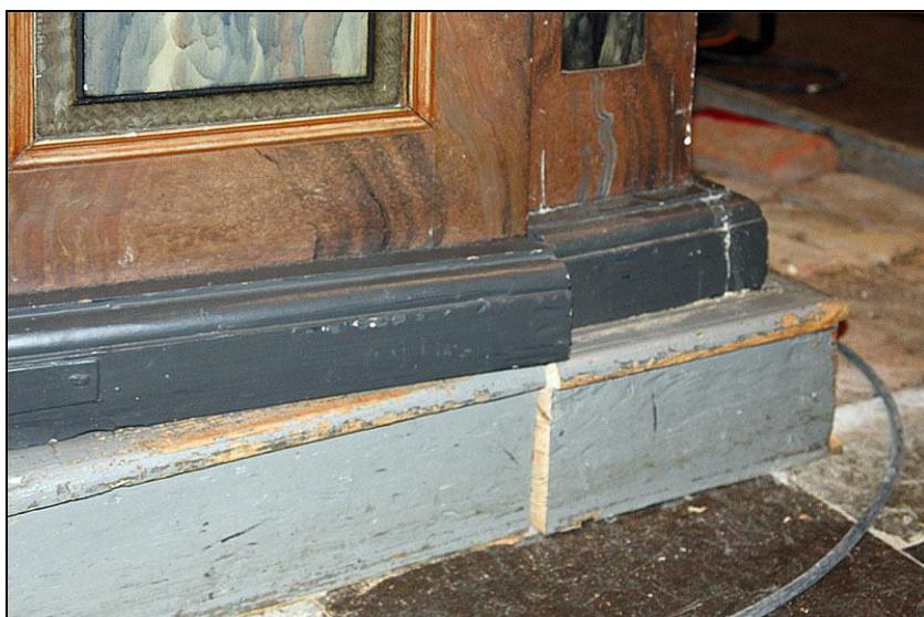
2010-09-28. Bänkkvarteret var något kilformat. Detta innebär att sockelns bakre del fick slipas ner för att gå i linje längs mittgången. Sockelns överstycke flyttades in för att passa i sin nya position.