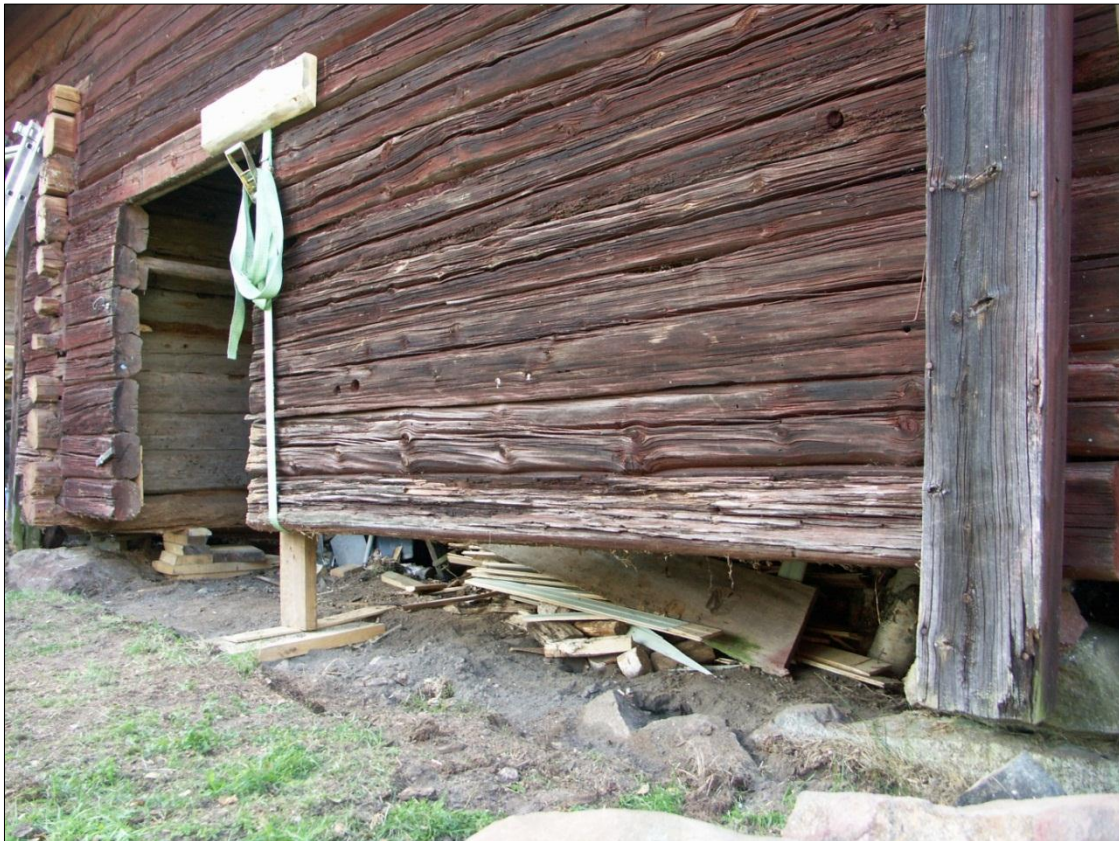
Timmerstommen har lyfts och riktats på bodlänga och portlider

Ifyllnadsstocken på bodens långsida mot väster och fägården har lyfts upp i läge. Markytan intill långsidan mot väster och fägården har grävts ur, grundstenar har frilagts och den utgrävda ytan har fyllts med dräneringssingel.