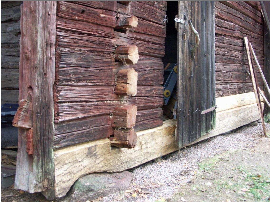
Ersatt syllstock som nu sluter an till portliderstolpen, ersatt parti i stockvarv två