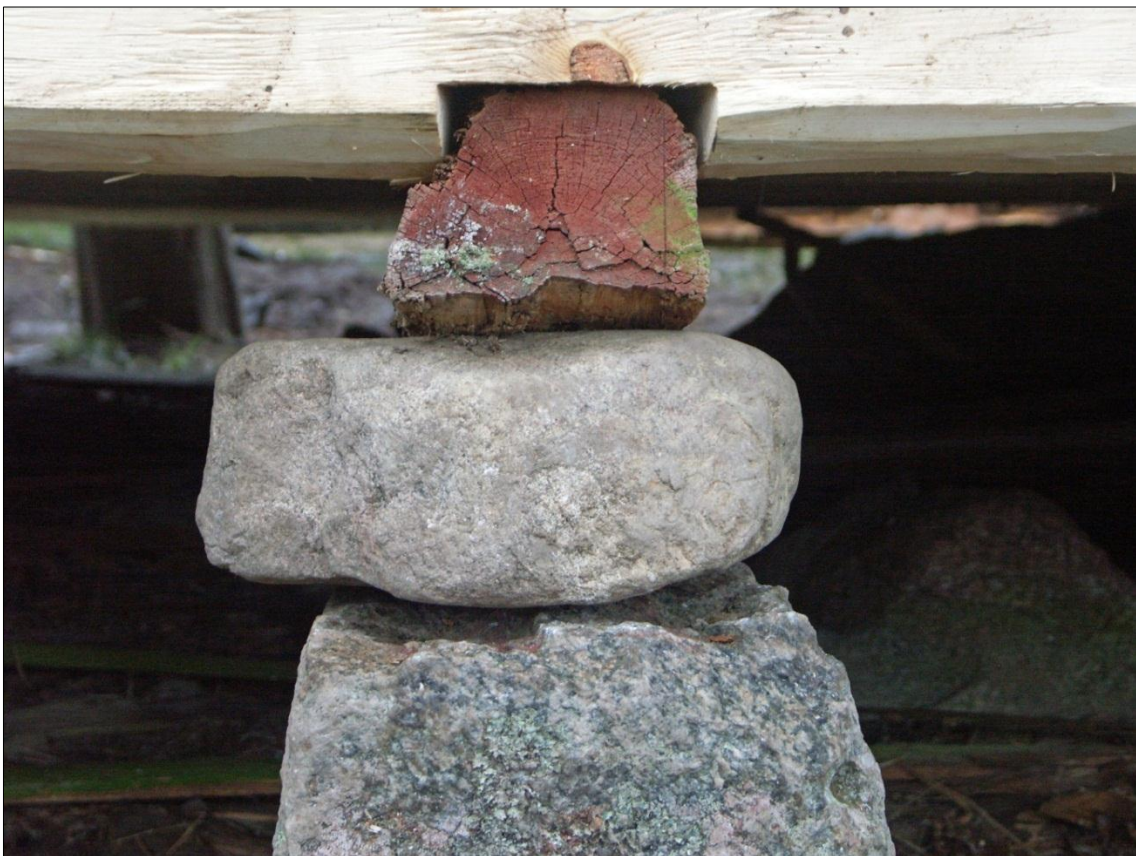
Golvhjälklag intimrat i syllstock och vilande på stenplint, magasinets långsida mot N