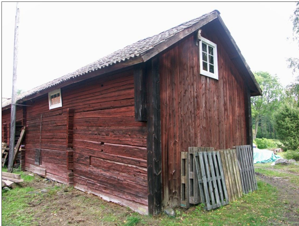
Längan med stallet, från SV

Stallets timmerstomme hade en rötškada i syllstock och i timmervarv på väggen på långsidan mot öster. Skadan har förorsakats av den sekundära duschkabin som tidigare har stått på platsen.