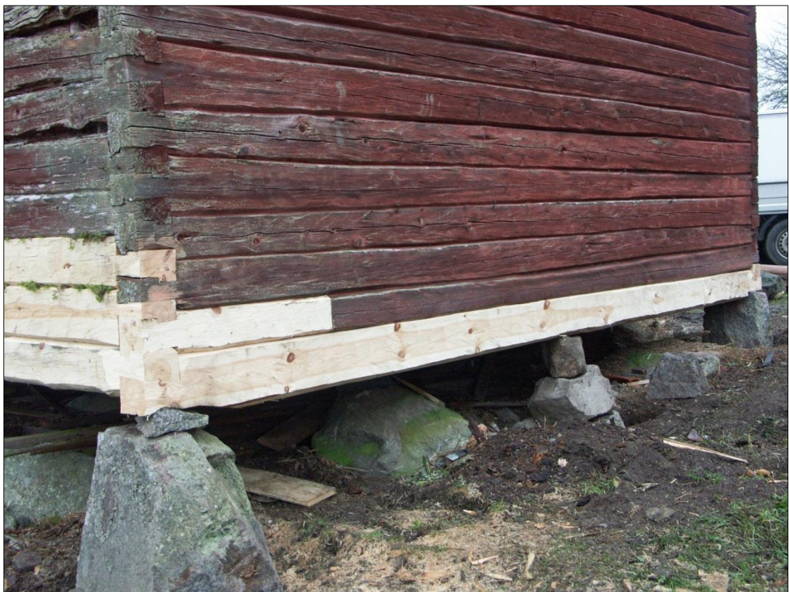
Ny syllstock och skarvat stockvarv på magasinets gavel mot V