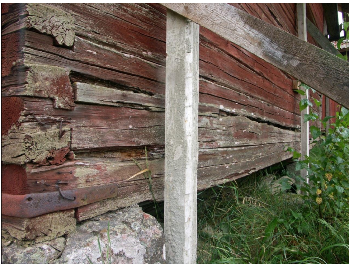
Långsidan mot N med rötskador i timmerstommen, fickor och halvsulningar