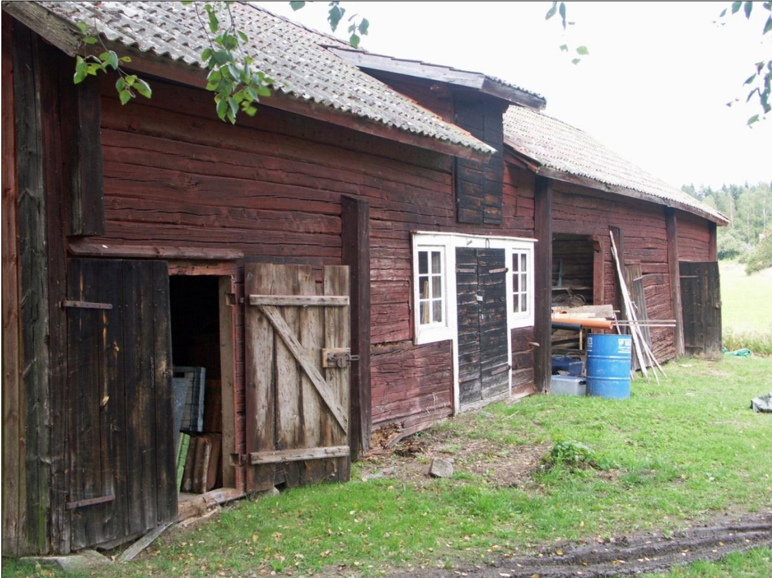
Längan med stall, lider och bod, från S

Längan med stall, lider och bodar med överliggande loft är uppförd med liggstomme på stengrund. Längans södra gavel utgörs av resvirke, med syllstock samt timmer i innanförhängande gavelröste. Timmerstommen är struken med faluröd slamfärg. Dörrar, luckor och knutbrädor är tjärstrukna/svartmålade. Det gemensamma sadeltaket har en täckning i enkupigt lertegel med takpannorna infällda i vindskidorna samt nockpannor.