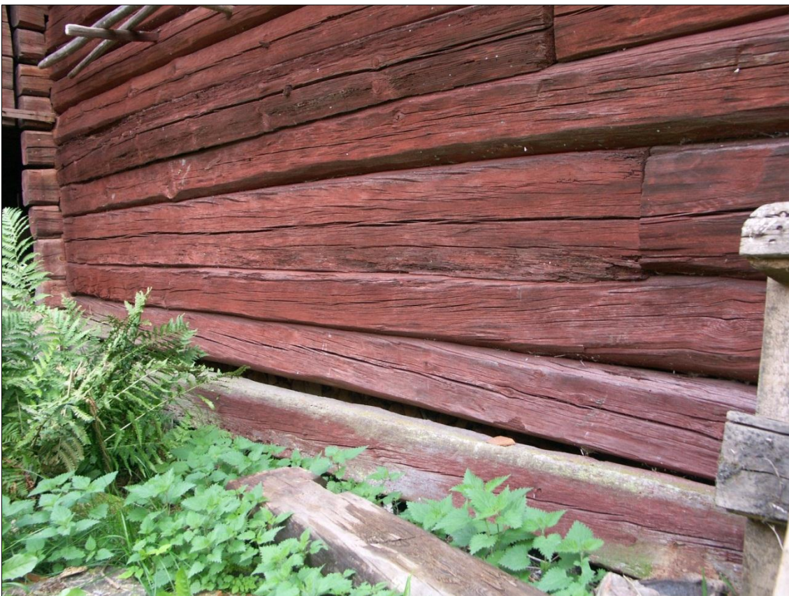
Ifyllnadsstocken på bodens långsida mot V hade sjunkit ned