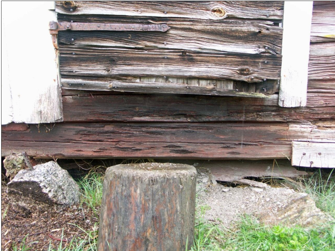
Syllstock/tröske i anslutning till boddörren närmast mot Ö