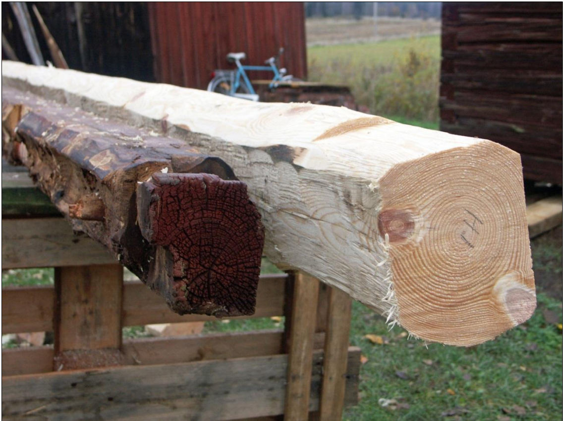
Tidigare befintlig syllstock från magasinets långsida mot S samt nytillverkad syllstock