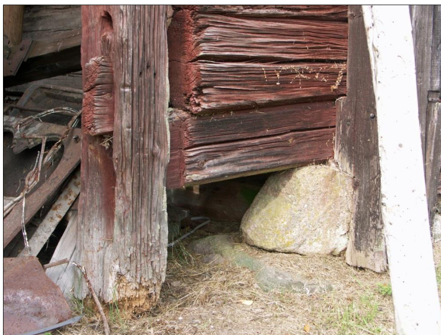
Rötskador i portliderstolpens nedre del, syllstocken ej framdragen till portliderstolpen