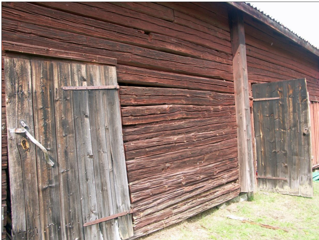
Bodlängans långsida mot Ö