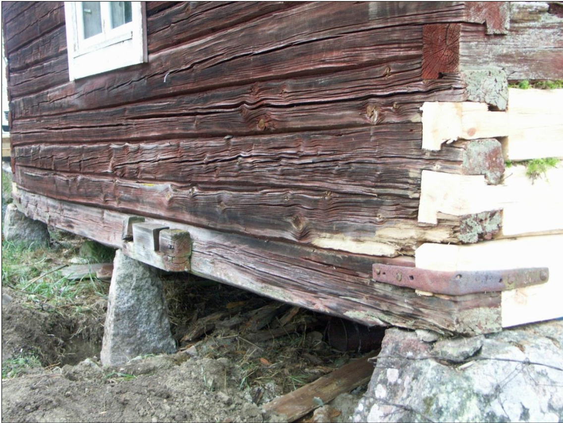
Stenplinten i anslutning till golvbjälklaget på magasinets gavel mot Ö efter utgrävning och justering