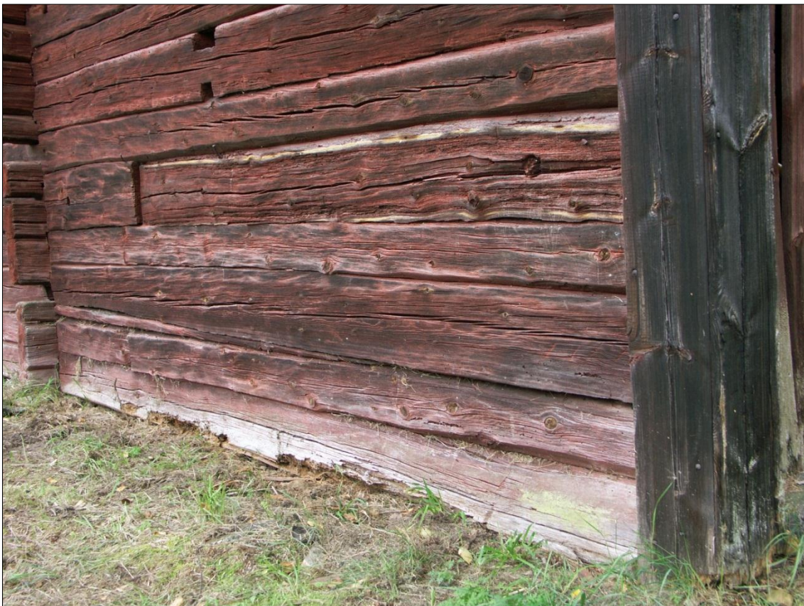
Ytliga rötskador i syllstock på stallets långsida mot V