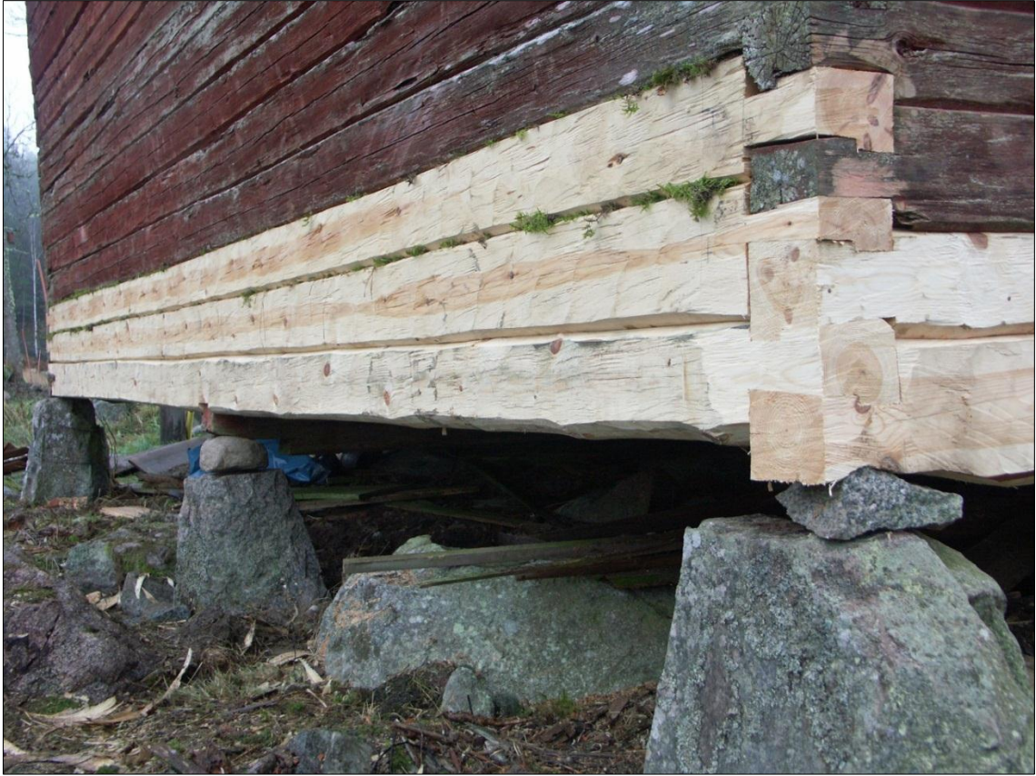
Ny syllstock och två nya stockvarv med haklaxknutar på magasinets långsida mot N