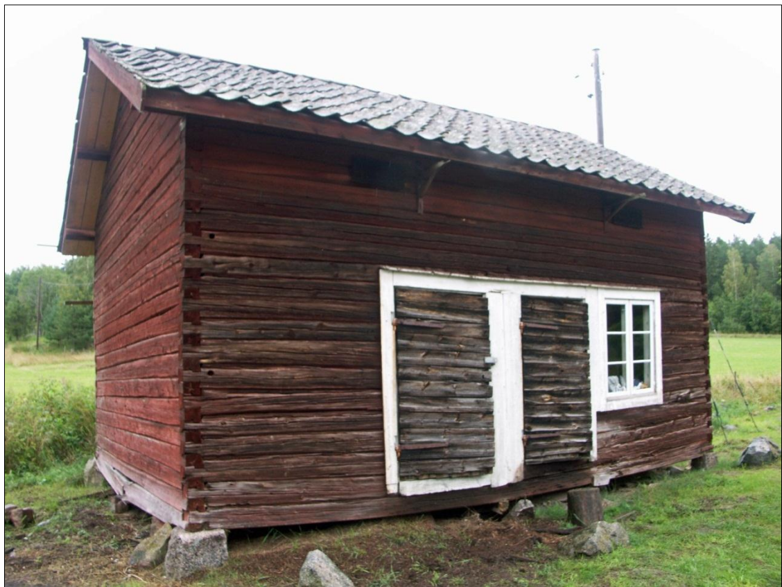
Magasinet's gavel mot V och långsida mot S