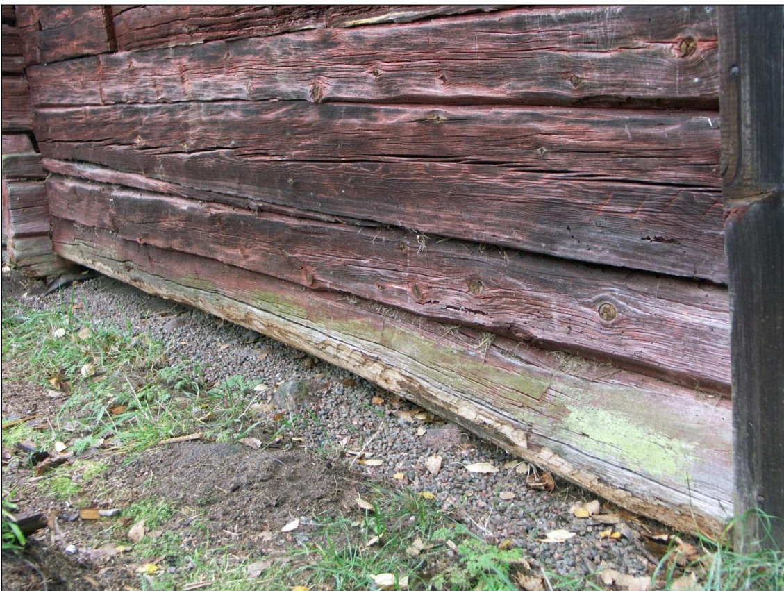
Syllstock på stallängans långsida mot V har rensats från rötskadade ytskikt