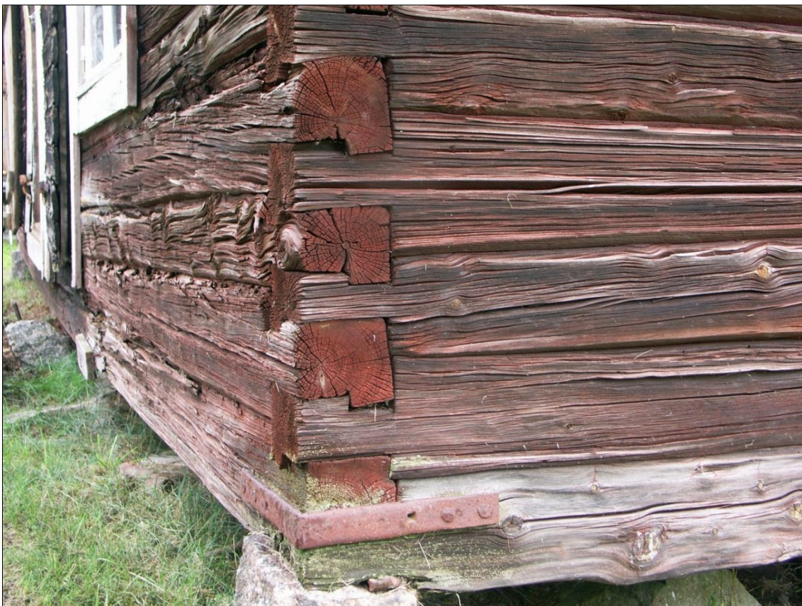
Haklaxknut i magasinets hörn mot SO