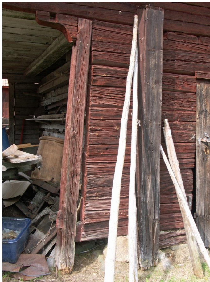
Utkalvande portliderstolpe th om portlidrets öppning mot Ö

Portliderstolpen th om portlidret och på lidrets östra sida hade glidit ut från den underliggande grundstenen. Portliderstolpen hade rötskador i det nedre partiet.