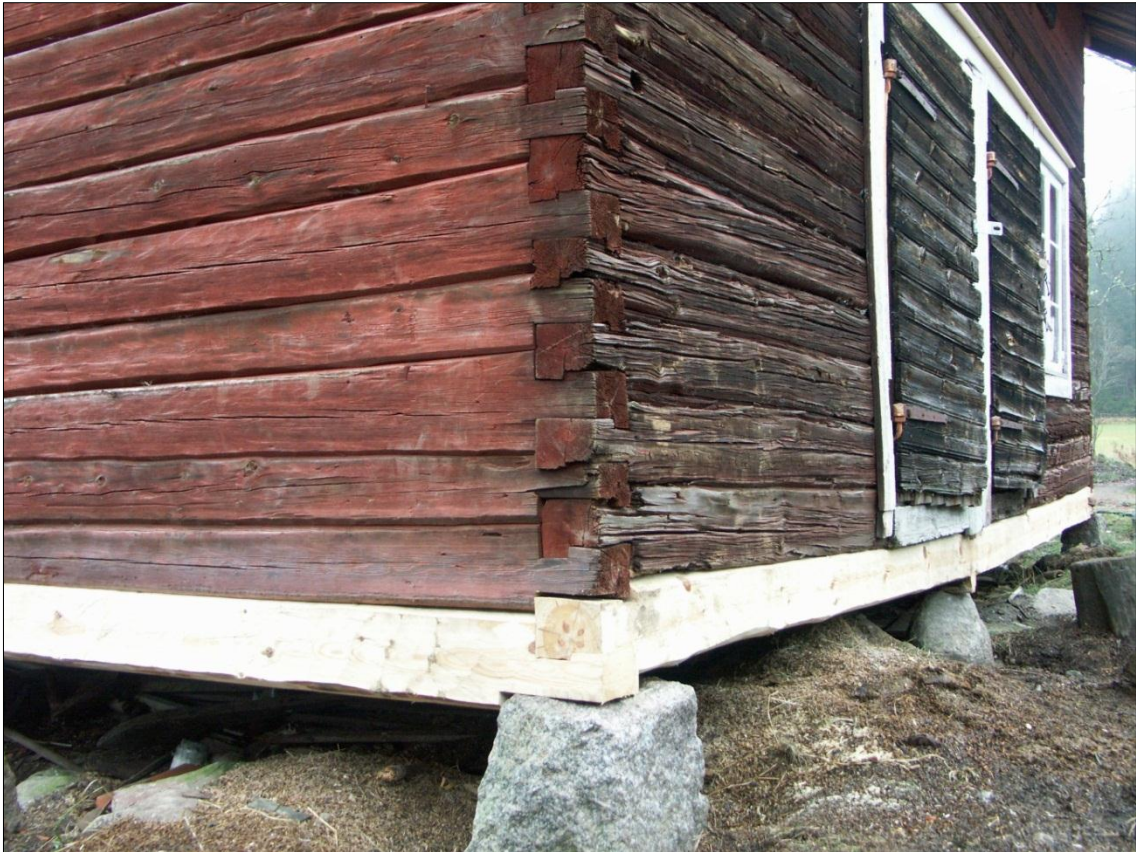
Nya syllstockar har monterats på magasinets gavel mot V och långsida mot S