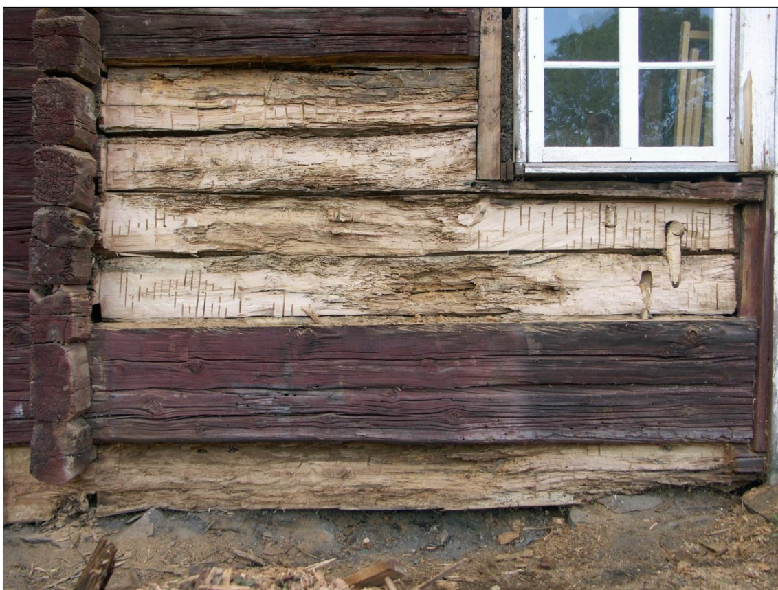
Syllstock och stockvarv fyra, fem, sex och sju har renbuggits från rötskadade partier

Markytan intill stallets långsida mot väster och fägården har grävts ur, grundstenar har frilagts och den utgrävda ytan har fyllts med dräneringssingel. Syllstocken har huggits rent från rötskadade partier, men har bibehållits i övrigt.