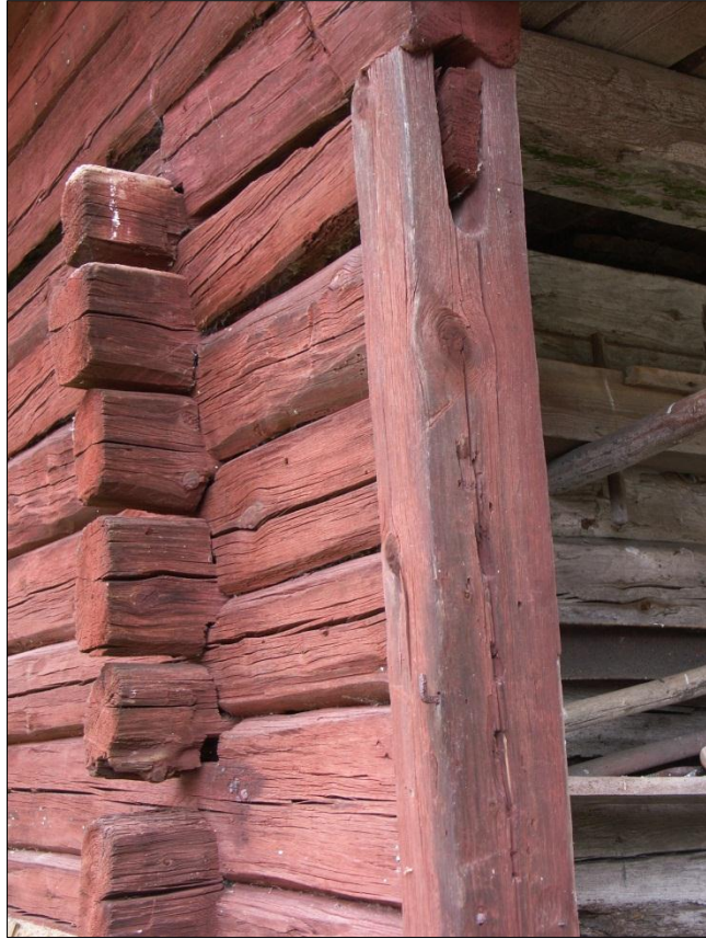
Stockvarv itappad i portliderstolpen i lidrets öppning mot V