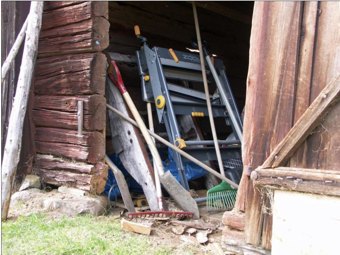
Tröskeln i bodens syllstock hade sågats bort i ett tidigare skede