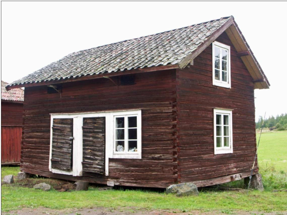
Magasinets långsida mot S och gaveln mot Ö

Magasinet är uppfört med liggtimmerstomme med haklaxknutar och vilar på stenplint. På byggnadens södra långsida finns två plankdörrar som leder in till varsin bod. Plankdörrarna har utvändigt en liggande spontad panel. En invändig trappa leder upp från den ena boden till loftet. Sadeltaket hade en täckning med enkupigt lertegel samt nockpannor. Tegeltäckningen lades om av fastighetsägarna 2012, då trasiga pannor ersattes. I samband med detta ersattes läkten och partier av underlagstaket.