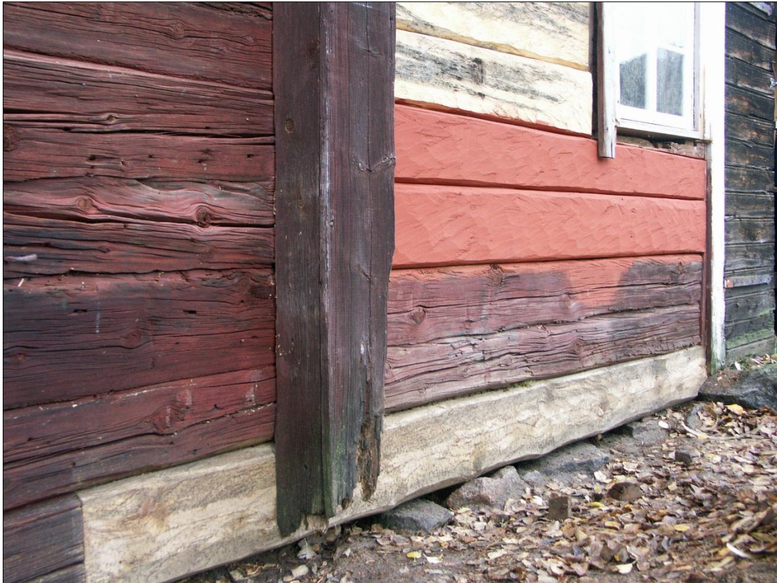
Stallets långsida mot Ö med ersatt partier av syllstock och stockvarv fyra samt rensade och halvslade partier