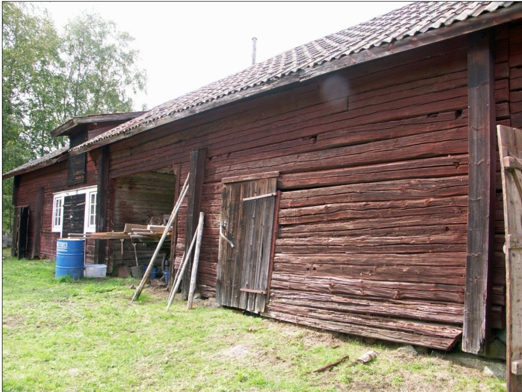
Längan med stall, lider och bod, från NO