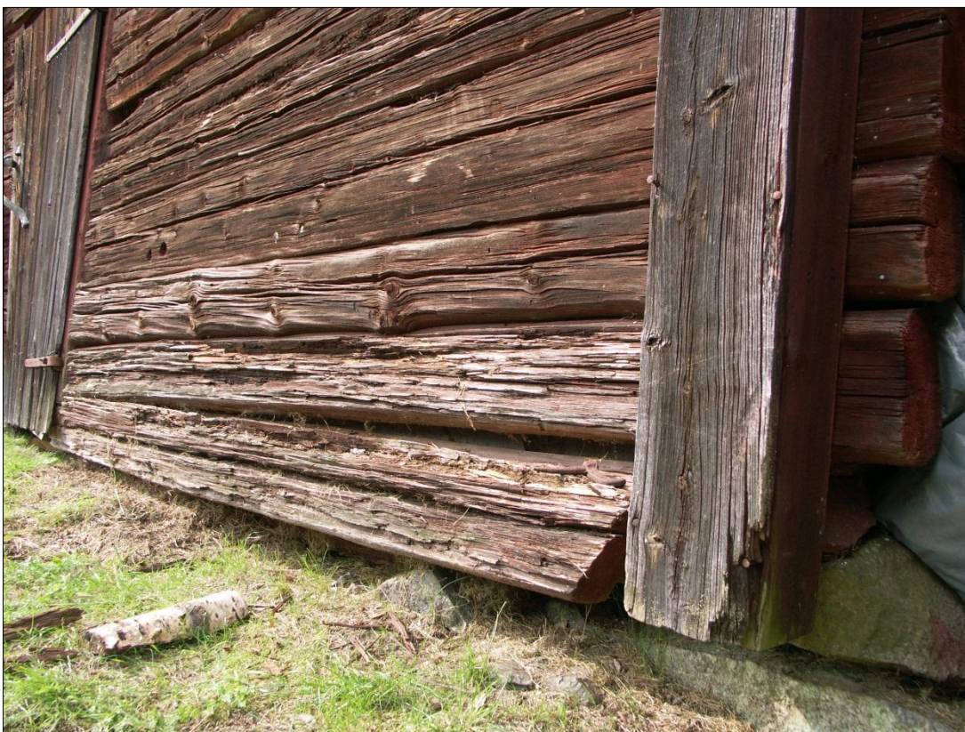
Syllstock som planerades att ersättas på boddelen närmast portlidret