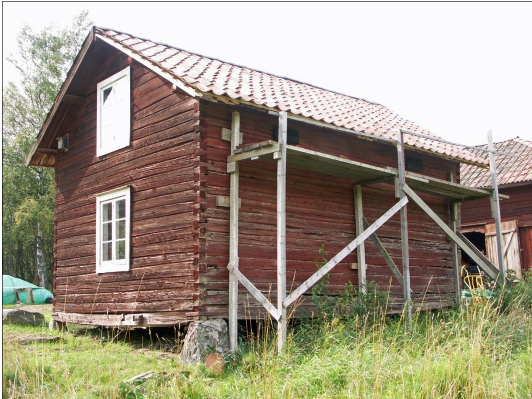
Magasinets gavel mot Ö och långsida mot N. På långsidan finns två ventilationsöppningar med luckor