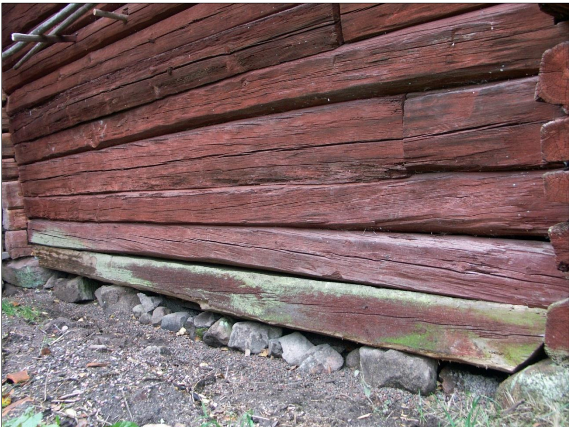
Ifyllnadsstocken på bodens långsida mot V har lyfts upp i läge och grundstenar har lagts på plats