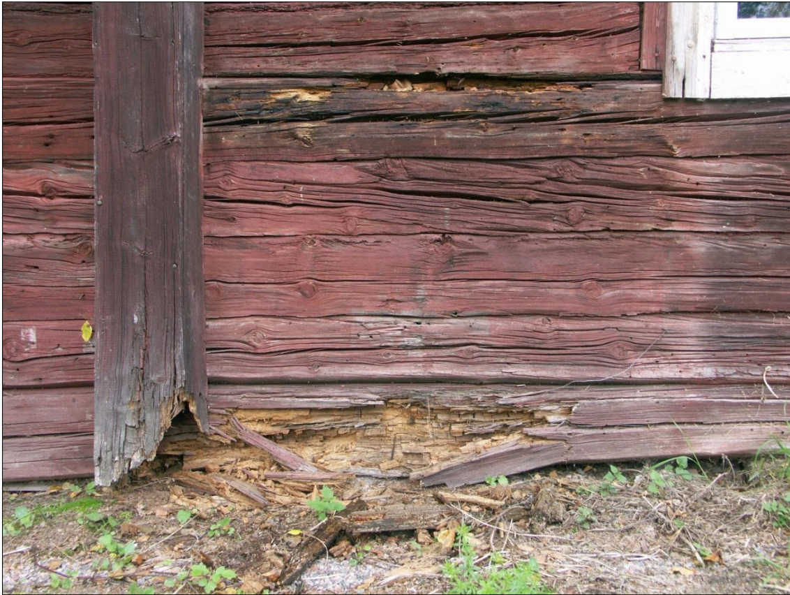
Rötskador i syllstock respektive i stockvarv på stallets långsida mot Ö