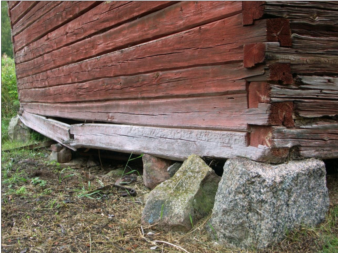
Brott i syllstocken på magasinets gavel mot V, i anslutning för håltagning för golvbjälklag