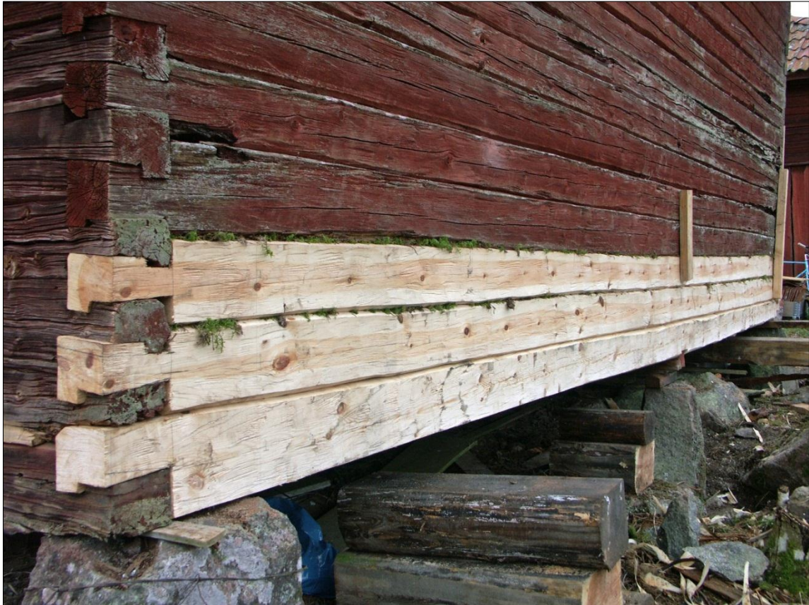
Ny syllstock och två nya stockvarv med haklaxknutar på magasinets långsida mot N