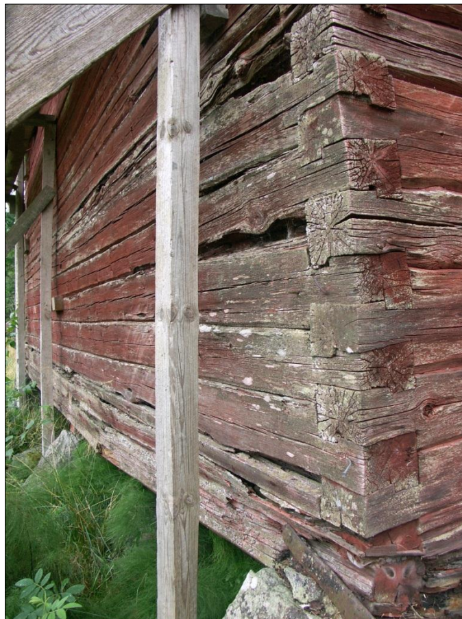
Långsidan mot N med rötskador i timmerstommen, fickor och halvsulningar