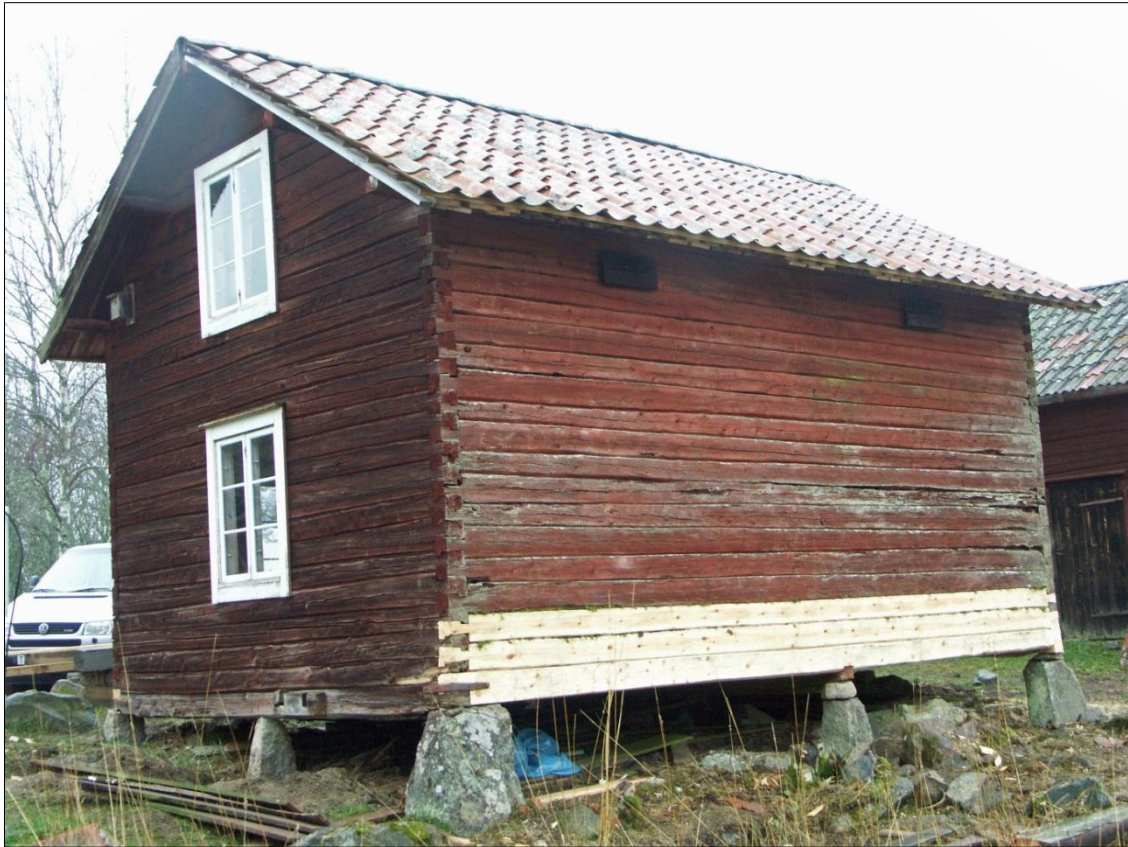
Ny syllstock samt två nya stockvarv på magasinets långsida mot N