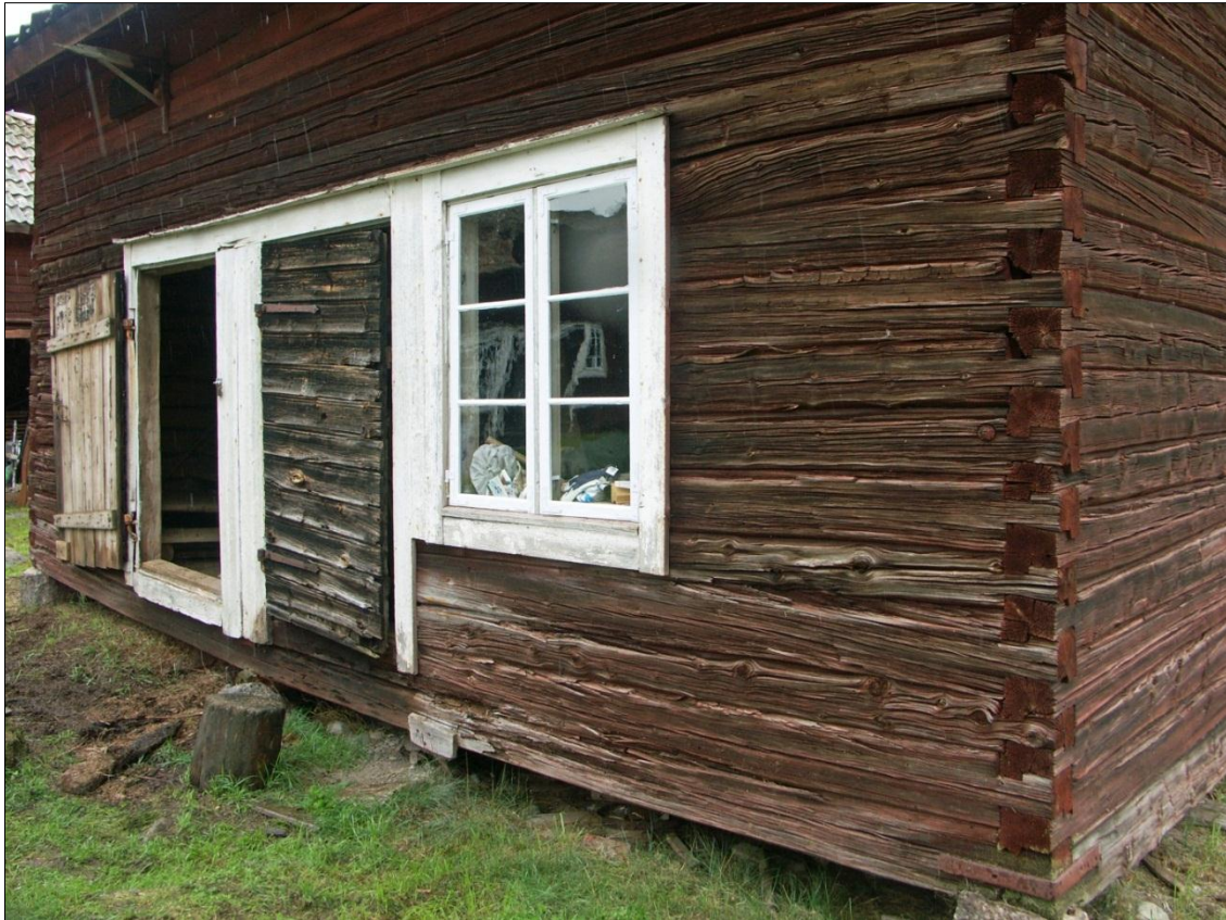
Magasinets långsida mot S med plankdörrarna till de två bodrummen