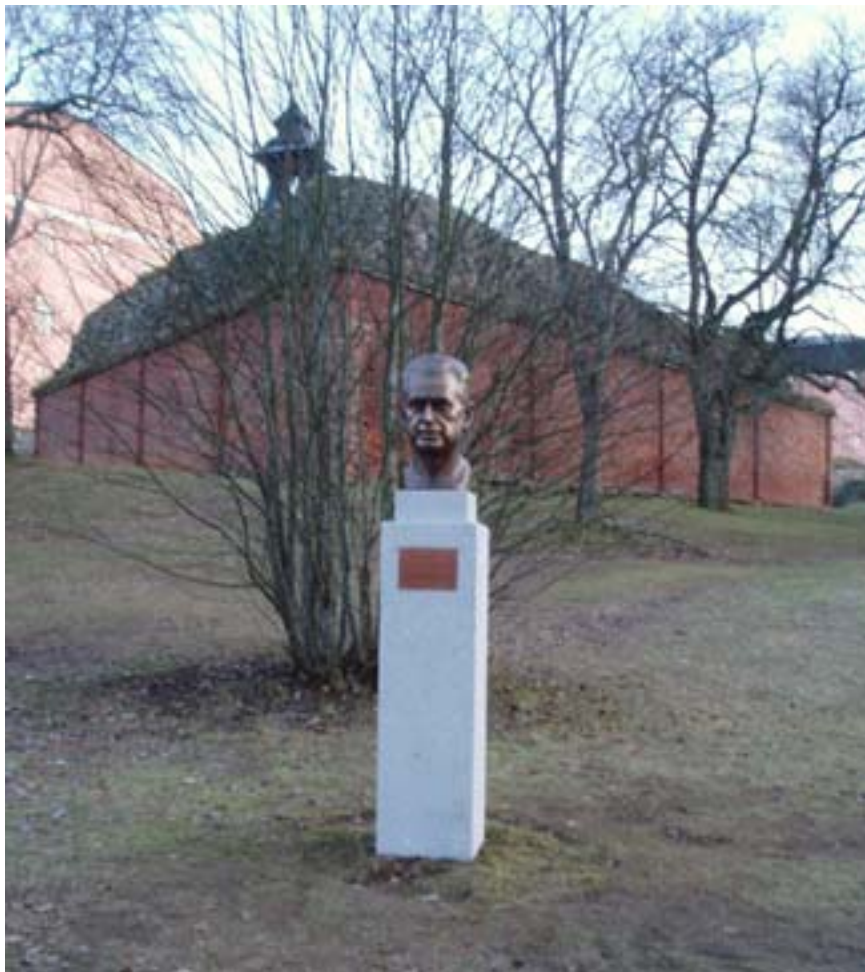
Figur 10. Bysten av Dag Hammarskjöld uppsatt och klar.

I samband med grundläggning och placering av en byst av Dag Hammarskjöld har Upplandsmuseet utfört en arkeologisk schaktningsövervakning och antikvarisk kontroll. Resultatet av arkeologin visade att inga äldre medeltida lager eller konstruktioner funnits på den schaktade ytan. Den antikvariska kontrollen utfördes eftersom ingreppet skedde inom statligt byggnadsminne. Här har uppförandet följt de anvisningar som angavs i tillståndet.