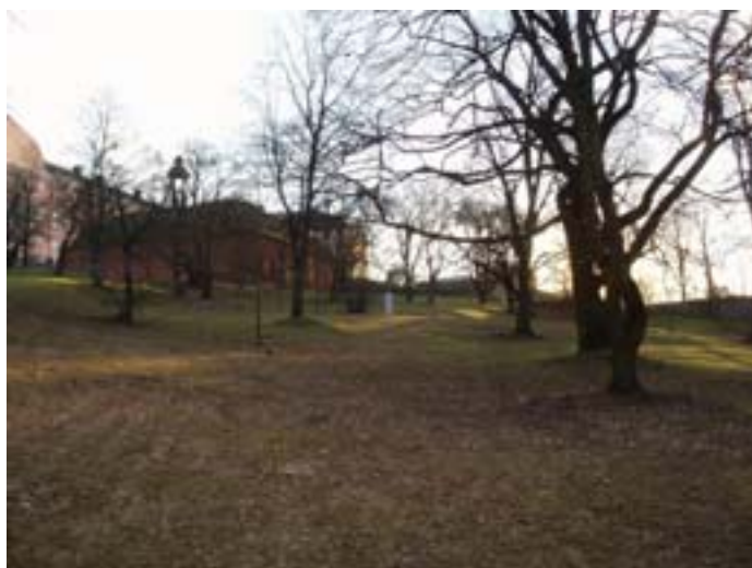
Figur 9. Som ovan, men från längre håll.