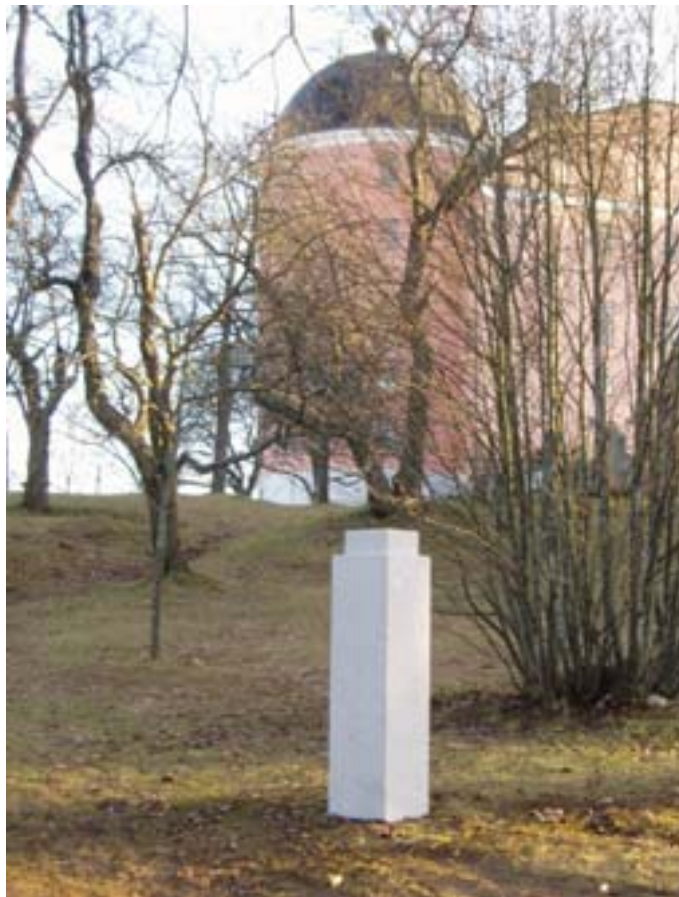
Figur 8. Sockeln färdigmonterad på platsen. Sett mot slottet.

Bystens uppförande och placering följer de intentioner som avsågs i ansökan till Riksantikvarieämbetet. Någon avvikelse har inte skett i förhållande till ansökan och Riksantikvarieämbetets synpunkter. Upplandsmuseet anser att placeringen inte har påverkat Uppsala slotts kulturhistoriska värde.