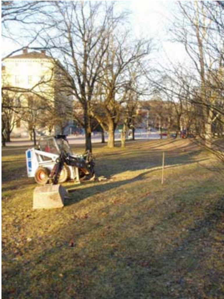
Figur 2. Platsen för bysten (käpp) innan schaktning för fundament påbörjats. Sett ner mot Carolina.