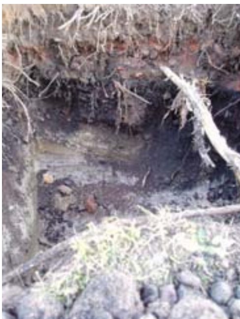
Figur 5. Foto av sektionen.