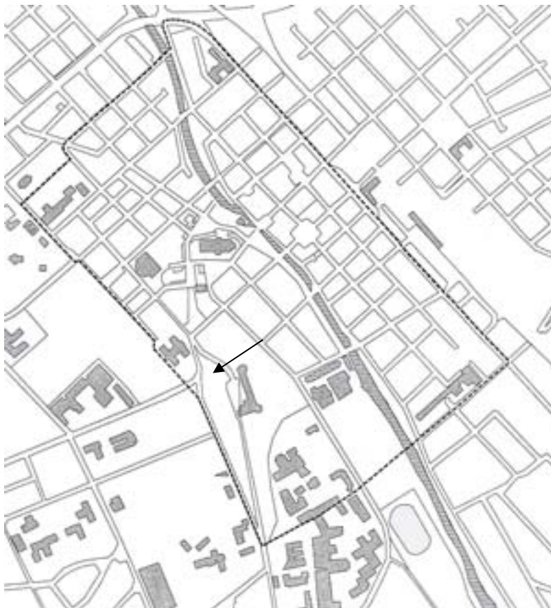
Figur 1. Platsen för bysten i Slottsbacken markerad med pil. Den streckade linjen markerar begränsningen för fornlämningsområdet för Uppsala stad, Raä 88.

Rapporten redovisar resultaten från de två ovanstående insatserna.