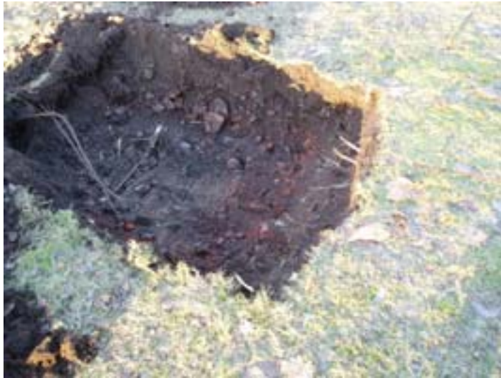
Figur 6. Gropen med lager 2 synligt i toppen.

Denna lagerföljd visar att platsen för bystens uppsättande inte uppvisar spår av medeltida eller historiska lämningar. Lager 2 som innehåller tegelfragment kan dock vara rester efter slottets uppförande eller olika ombyggnationer som skett sedan dess. Några spår efter äldre aktiviteter, såsom förhistoriska gravar fanns inte.