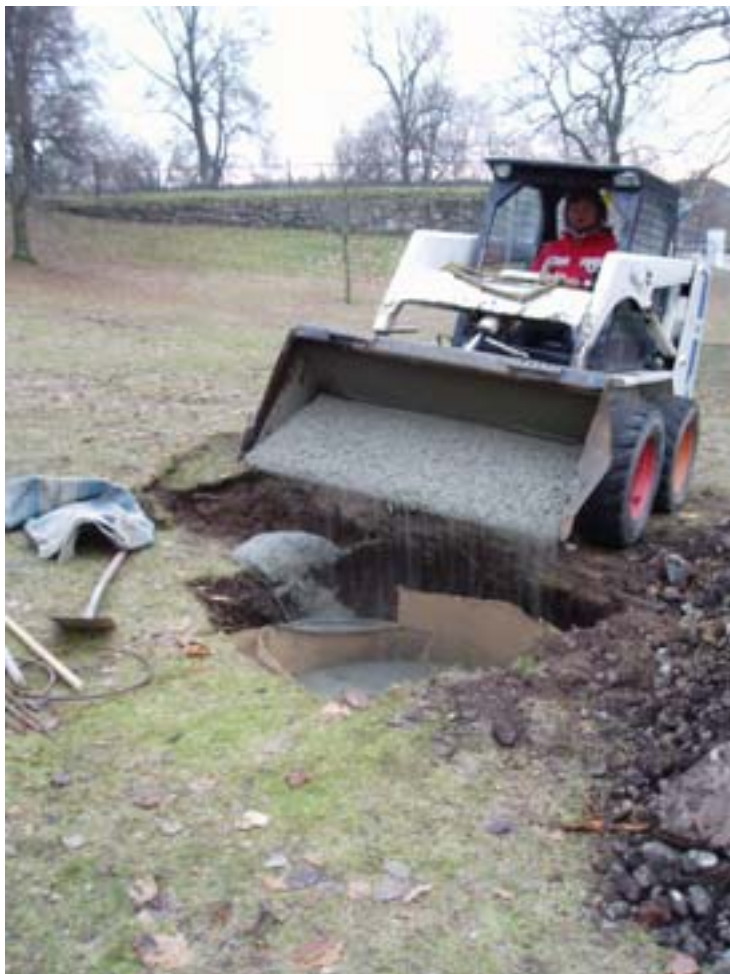
Figur 7. Gropen fylls med betong innan sockeln sätt på plats.

Denna lagerföljd visar att platsen för bystens uppsättande inte uppvisar spår av medeltida eller historiska lämningar. Lager 2 som innehåller tegelfragment kan dock vara rester efter slottets uppförande eller olika ombyggnationer som skett sedan dess. Några spår efter äldre aktiviteter, såsom förhistoriska gravar fanns inte.