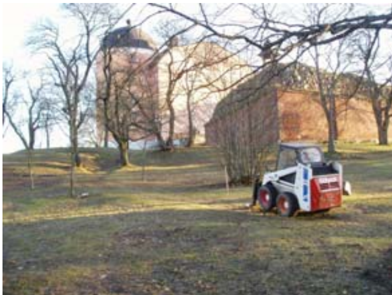
Figur 3. Platsen för bysten (käpp) innan schaktning för fundament påbörjats. Sett mot slottet.