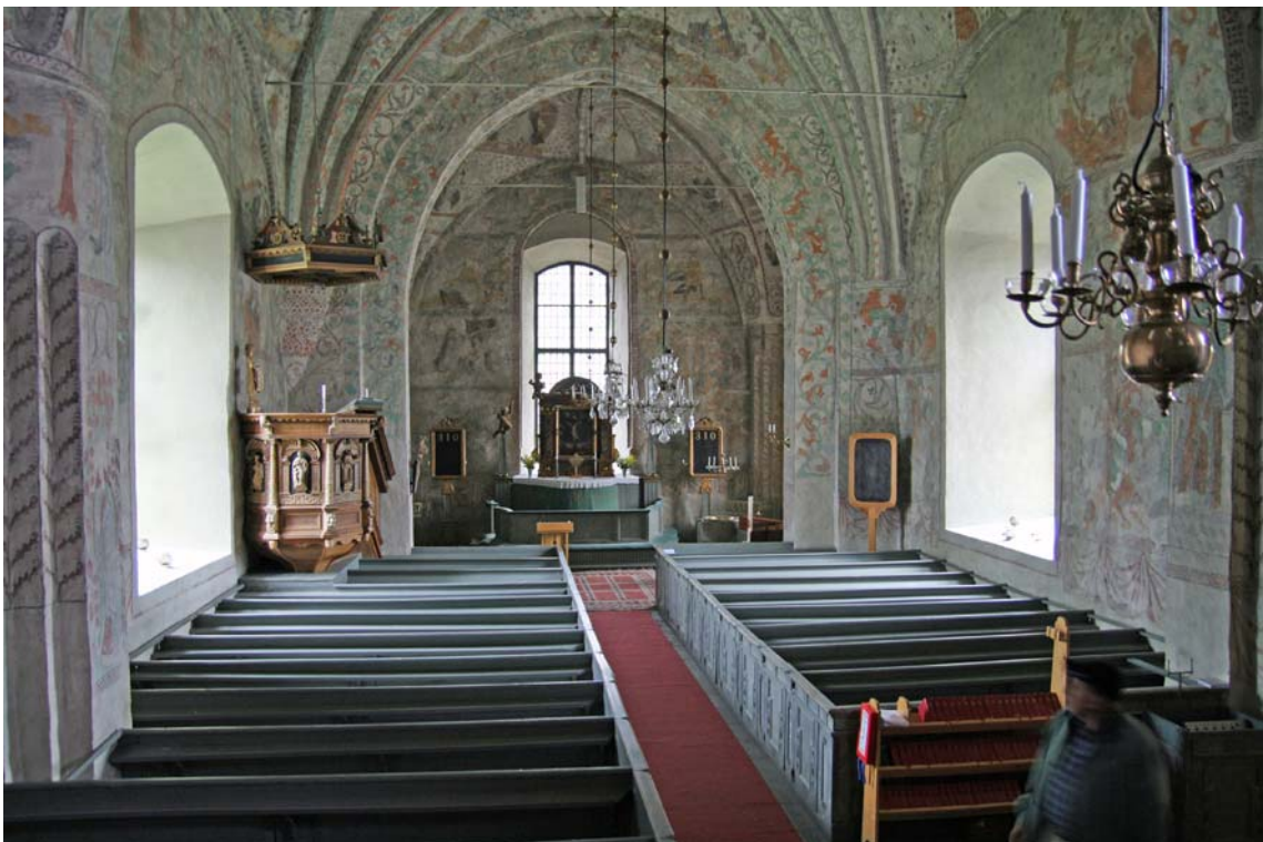
Interiör mot koret i öster, före den invändiga renoveringen. DIG006086.