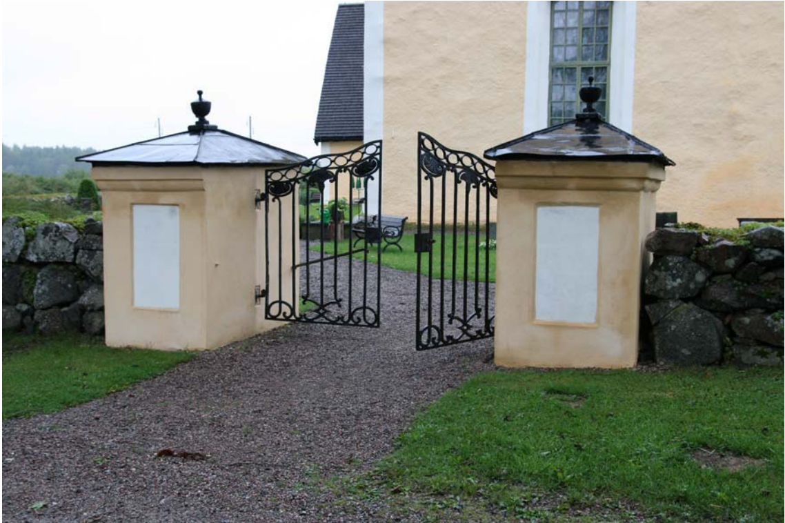
Grindstolparna i östra muren sedan de avfärgats. DIG006081.