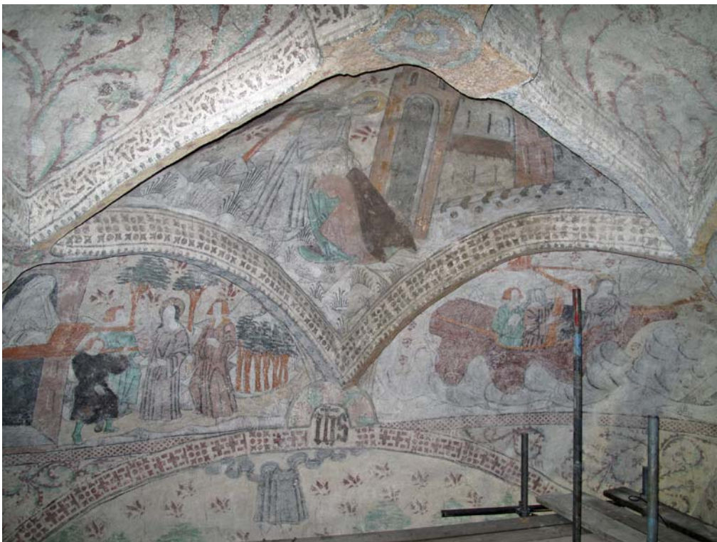
Valv i långhuset efter konservering. DIG006092.