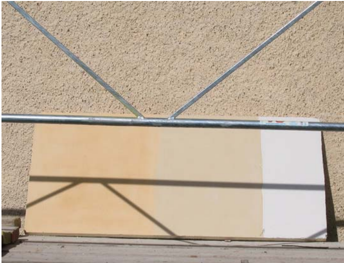
Färgprover som målats upp före renovering. Den vänstra färgen valdes till spitputsen.

Invändigt har rengöringen och konserveringen av målningarna bidragit till att upplevelsen av de sentida kalkmålningarna förstärks.