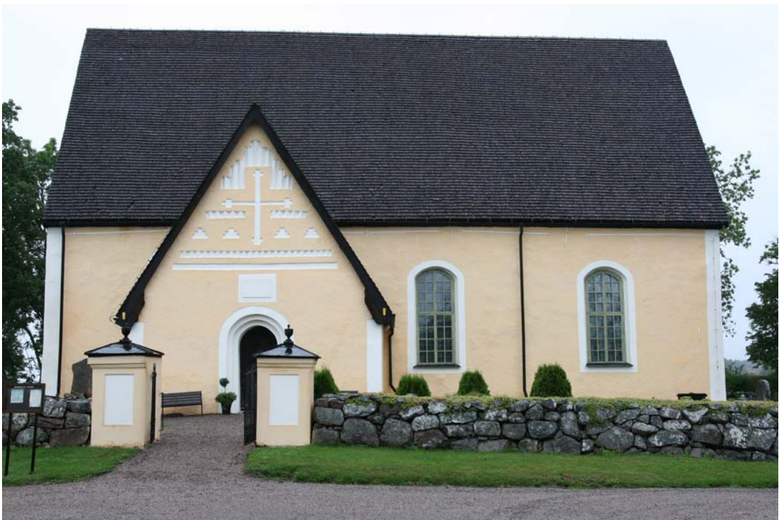
Fasad mot söder och grindstolpar efter avslutad renovering. DIG006082.