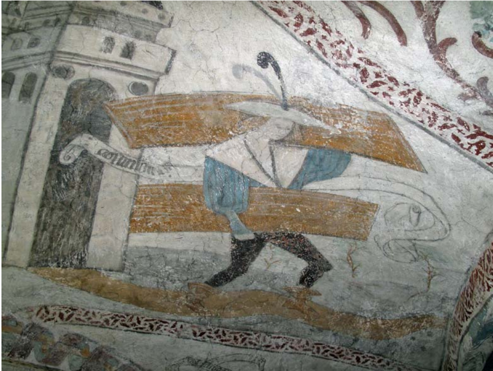
Valvmålning i koret efter konservering. DIG006090.