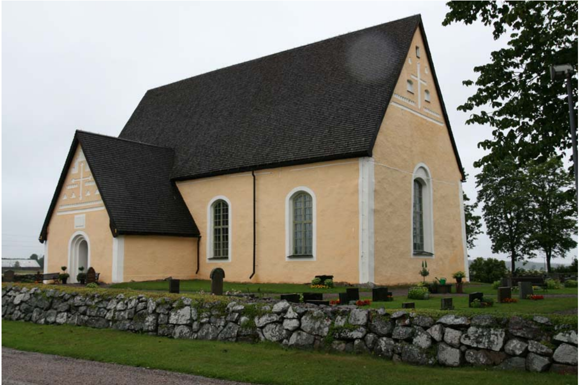
Vy från sydost efter avslutad renovering. DIG006083.