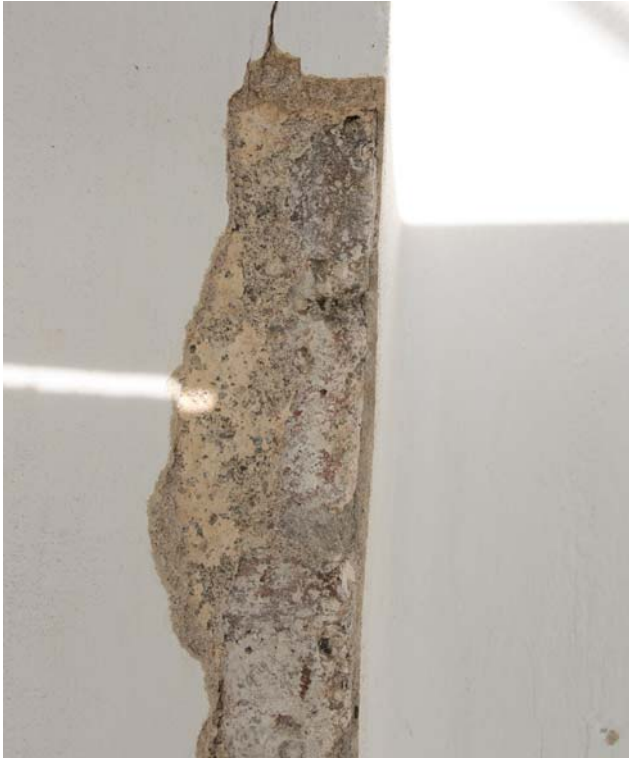
Putsskada vid långhusets sydvästra hörn. Under den vita slätputsen ses en äldre ockragul puts. DIG006071.