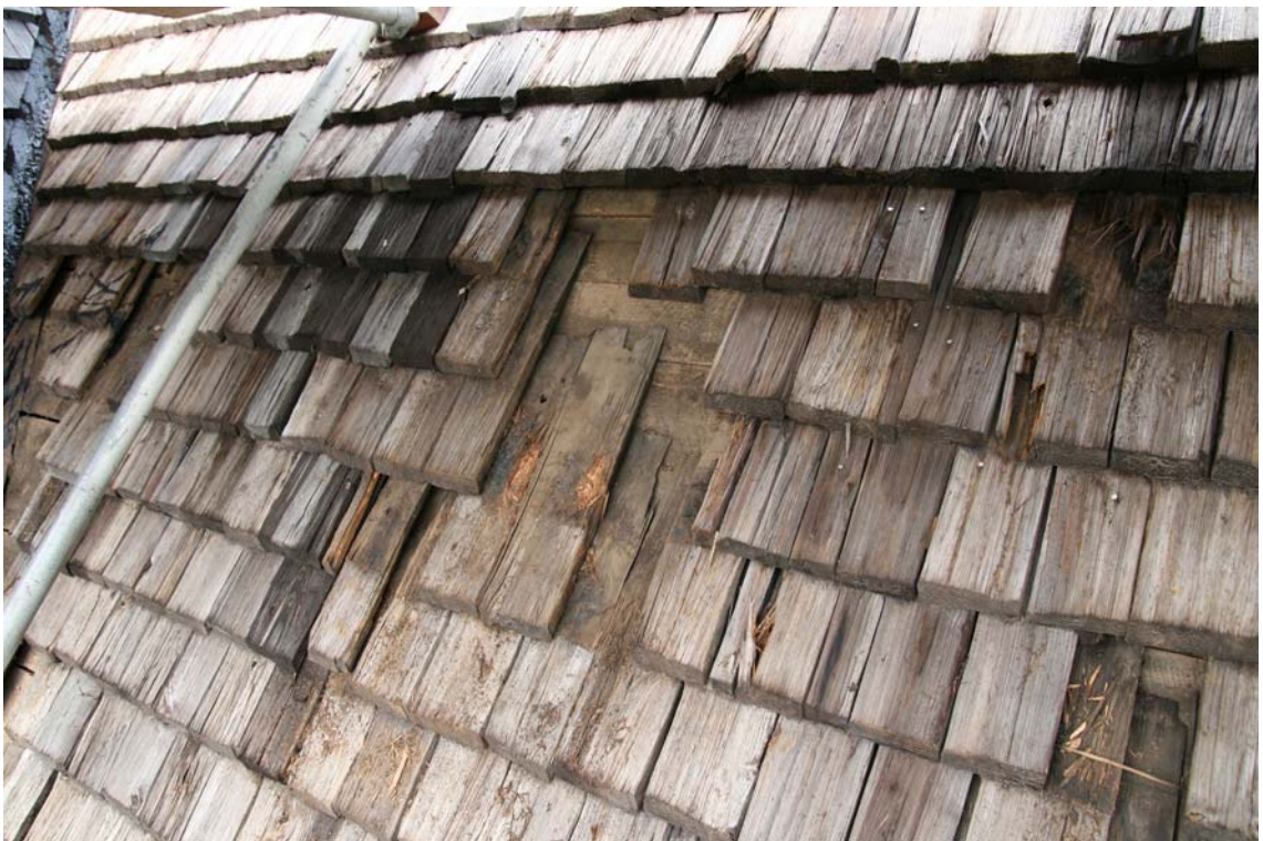
Trasiga spån på långhusets södra takfall. DIG006080.