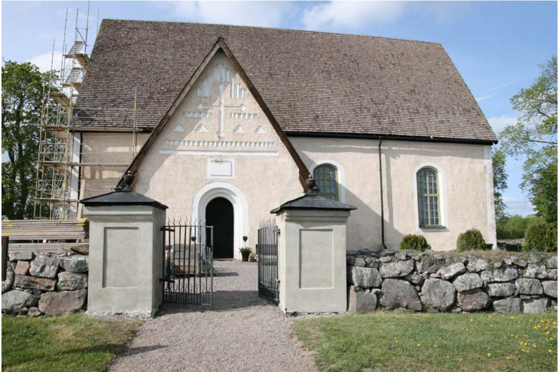
Foto i maj 2008 innan fasadrenovering. Grindstolparna har redan putslagats men ej avfärgats. DIG006075