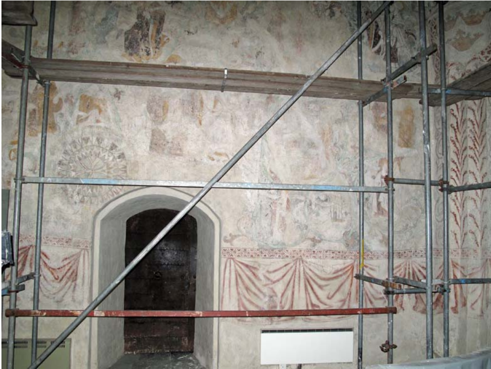
Norra korväggen hade relativt stora sprickor i putsen. Bilden visar hur sprickorna lagats men ännu ej retuscherats klart. DIG006094.