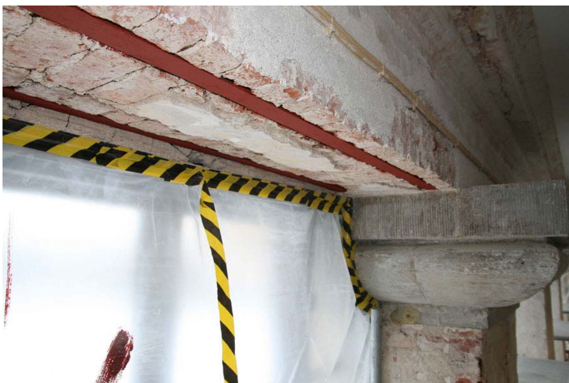
Plattjärn hade lagts in som förstärkning mellan pelarna. Järnet har här rostskyddsmålats med linoljeblymönja. DIG005470.