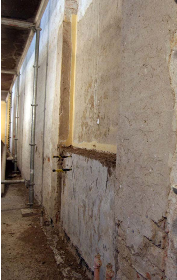
På norra väggen hade två av nischerna försetts med klackar av betong som bilades bort. DIG005484.