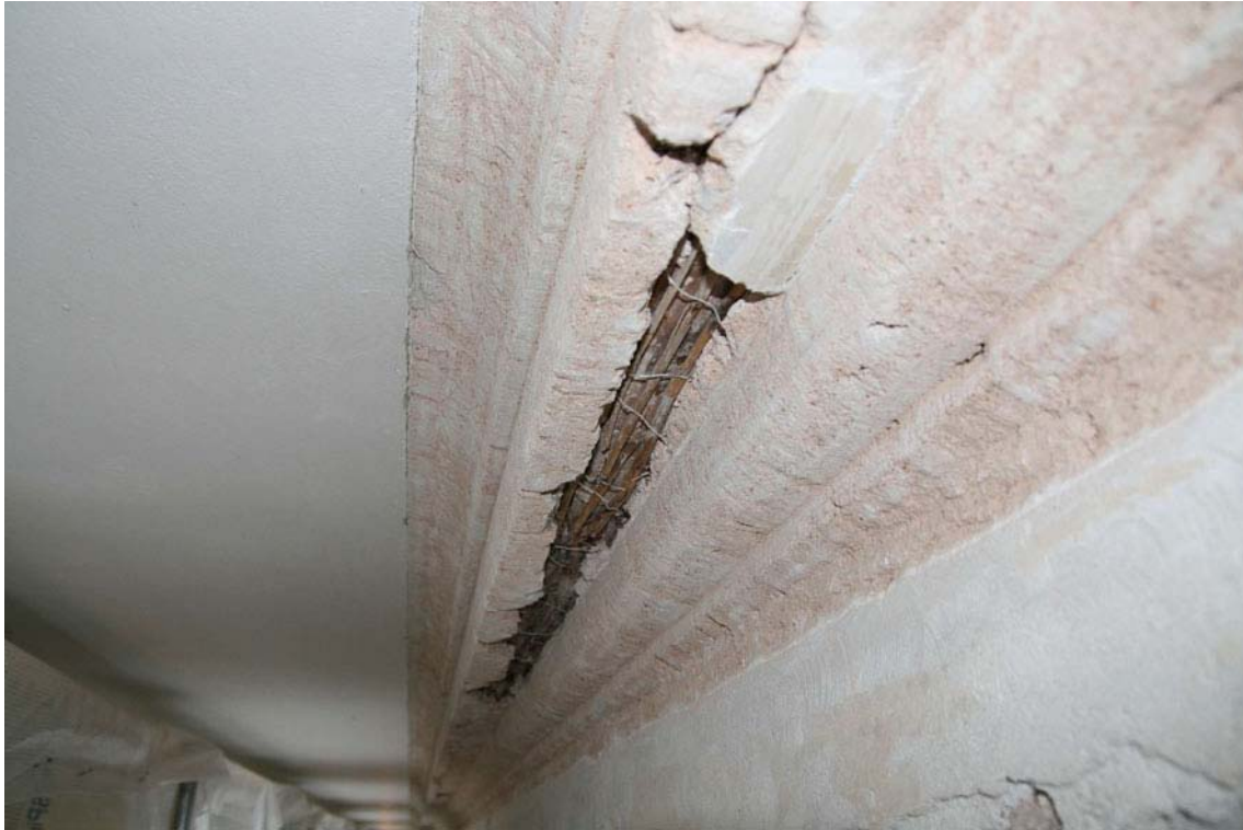
Taklisten är putsad på en trästomme som försetts med vassrör. Kalkbruket är rödaktigt och tyder på att krossat tegel blandats i bruket. Vägghputsen har en annan sammansättning med ljusgrått kalkbruk. DIG005469