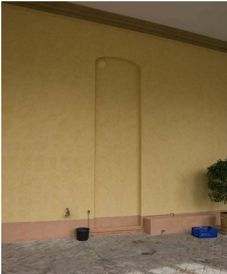
Så här ser nischen ut efter återställandet, sedan betongklacken avlägsnats. DIG004967.