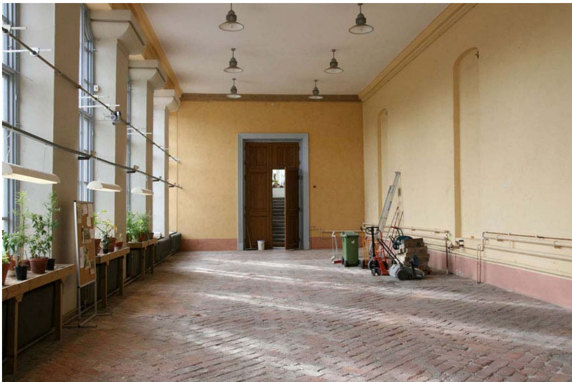
Bild från orangeriet hösten 2008 sedan den första etappen på västra kortväggen färdigstälts. Den nya färgen är något starkare pigmenterad jämfört med den gamla färgen som syns till höger. Tidigare målades även taklisten gul. DIG005465.