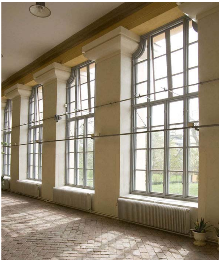
Pelarraden mot söder efter avslutad renovering. Nu har även radiatorer och fönsterbänkar målats i samma ljusa kulör som pelarna. DIG004968.