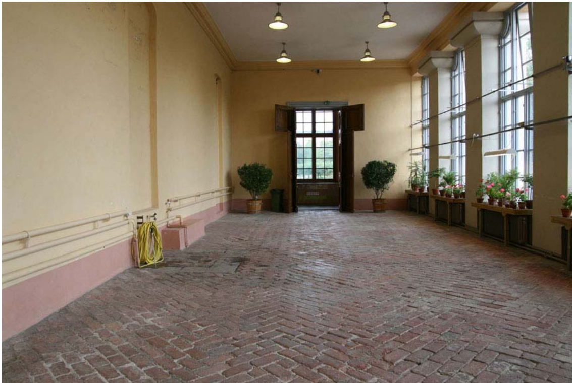
Orangeriet före renoveringen hösten 2008. Den då befintliga väggfärgen slagnade från underlaget. Värmeledningsrören på långsidans vägg till vänster avlägsnades vid renoveringen. DIG005458.

Arbetet är väl utfört med stor hantverksskicklighet. Den nu genomförda renoveringen har bidragit till att stärka orangeriets kulturhistoriska värde eftersom väggar och pelare nu behandlats med ursprungliga, traditionella material samt med ursprunglig färgsättning.