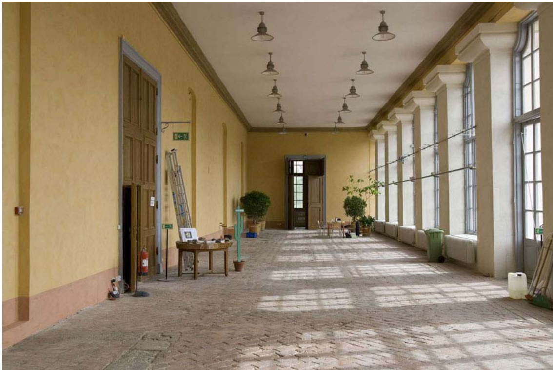
Orangeriet våren 2009 efter avslutad renovering och efter att växterna flyttats ut i trädgården. Den nya färgsättningen återspeglar den utvändiga fasadfärgen på Linnéanum. DIG004965.