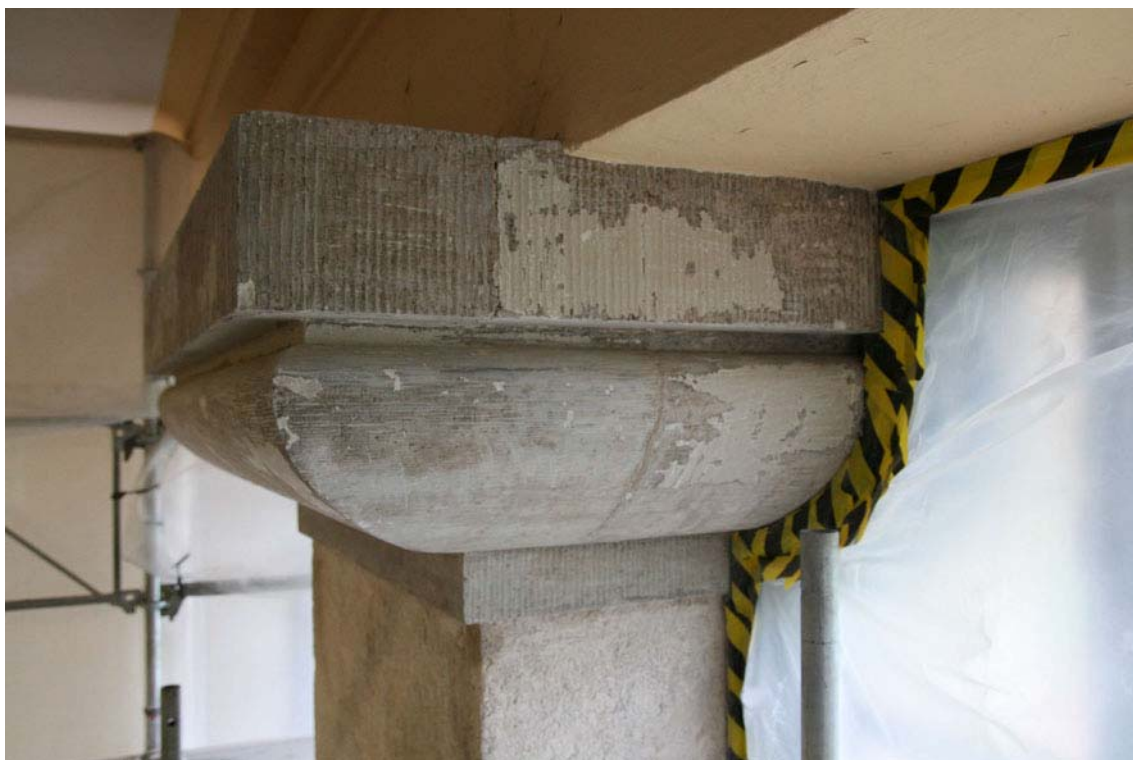
Sandstenskaptäl som rengjorts ner till fast underlag. Rester av gammal ljusgrå oljefärg syns på den övre räfflade ytan. DIG005454