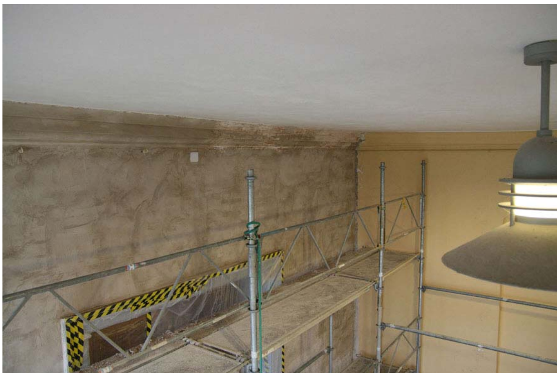
Arbetet inleddes med en första etapp i september 2008 då västra kortsidan samt den västligaste pelaren i fönsterväggen renoverades. Här ses väggen sedan ytputsens frästs ner. DIG005446.