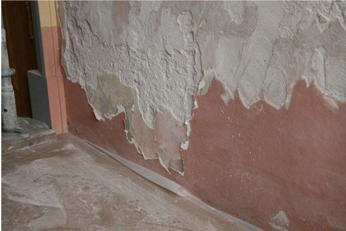
Bild från östra kortsidan sedan man börjat fräsa ner ytputsen. Här ses rester av ursprunglig sockelputs med rödaktig kalkfärg. DIG005481.