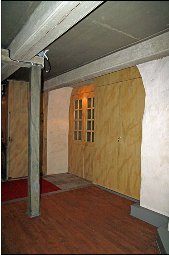
Bänkkvarteret under norra delen av läktaren efter ändringarna.